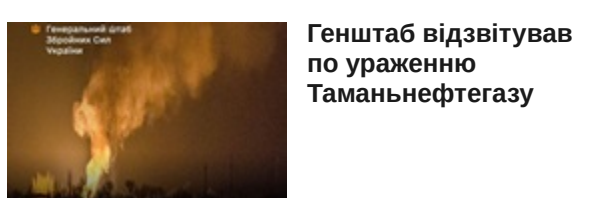
Генштаб відвітував по ураженню Таманьнефтегазу

СОКЕТ Вторгнення Росії в Україну. Онлайн