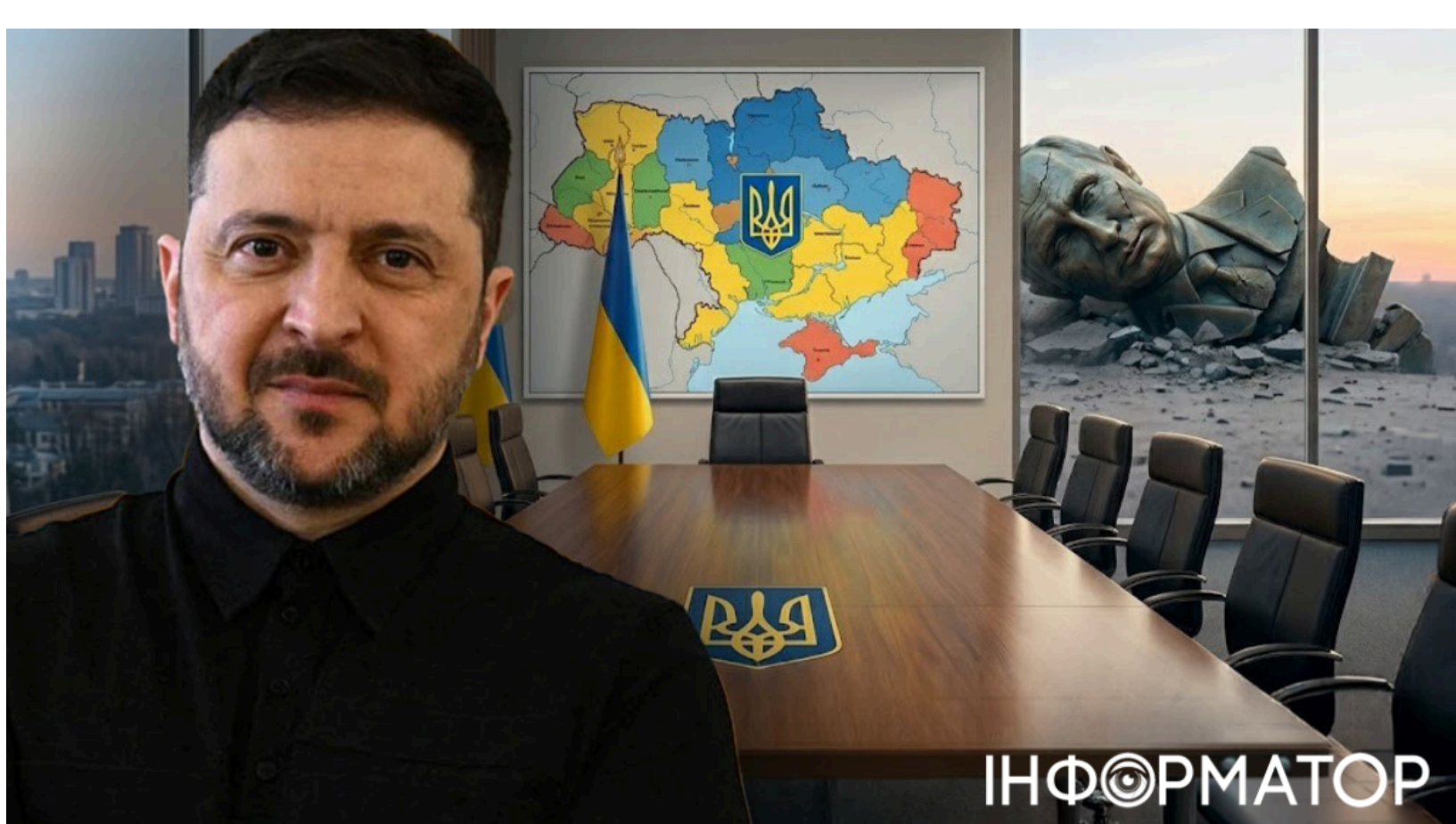
Зеленський - мир можна укласти без Путіна

Президент України Володимир Зеленський заявив, що Росія ігнорує всі пропозиції миру, і натякнув на можливість майбутніх переговорів з іншим керівником Кремля. Готовність до прямих перемовин з Путіним він підтверджував і раніше - 3 червня під час брифінгу з генсекретарем НАТО Марком Рютте в Києві. Цього разу він пішов далі: якщо нинішнє керівництво Росії продовжуватиме уникати реальних домовленостей, партнером по переговорах може стати хтось інший .