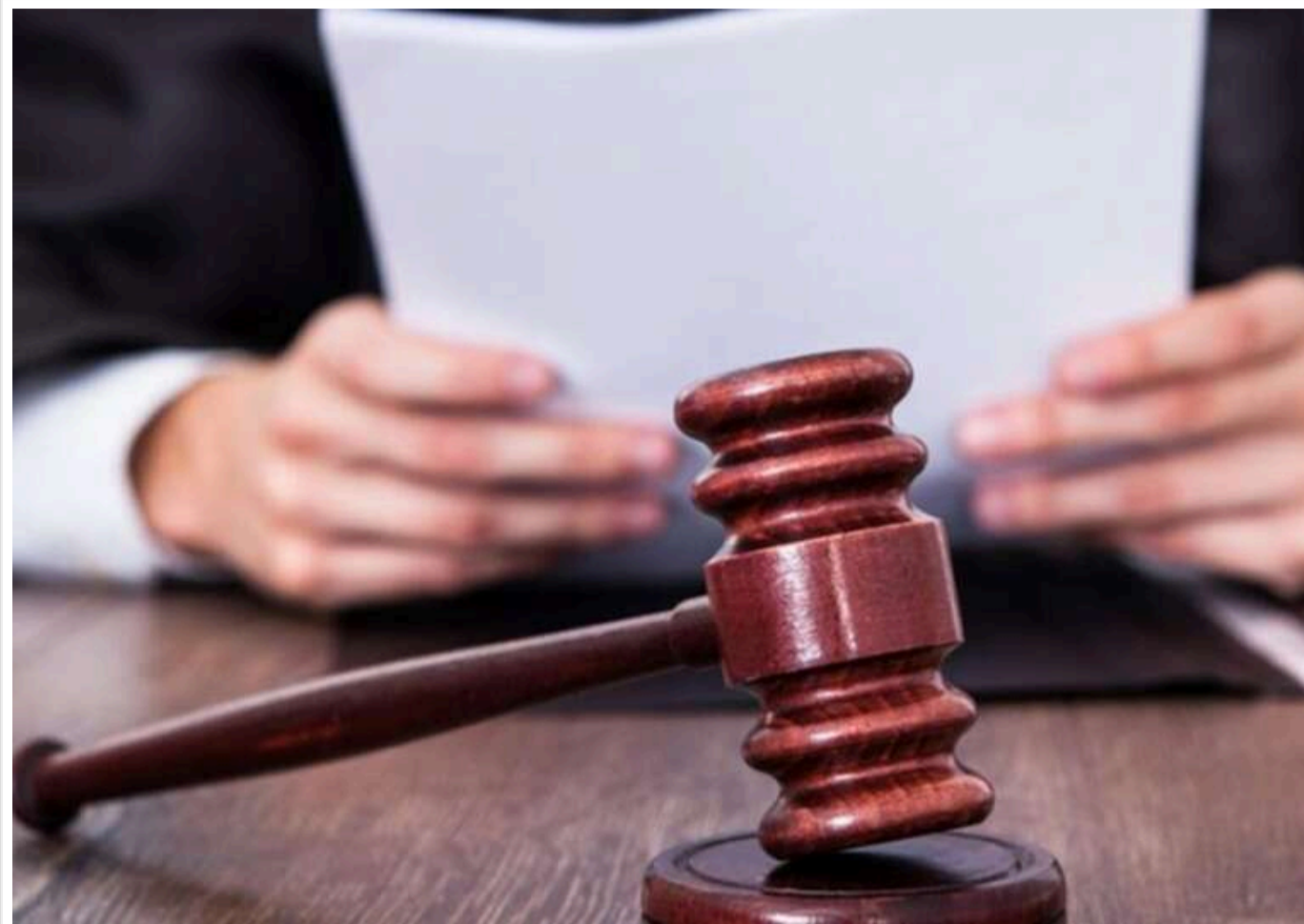
«Знижка» у 2,5 рази: у Миколаєві військового оштрафували за заниження вартості ввезеного авто