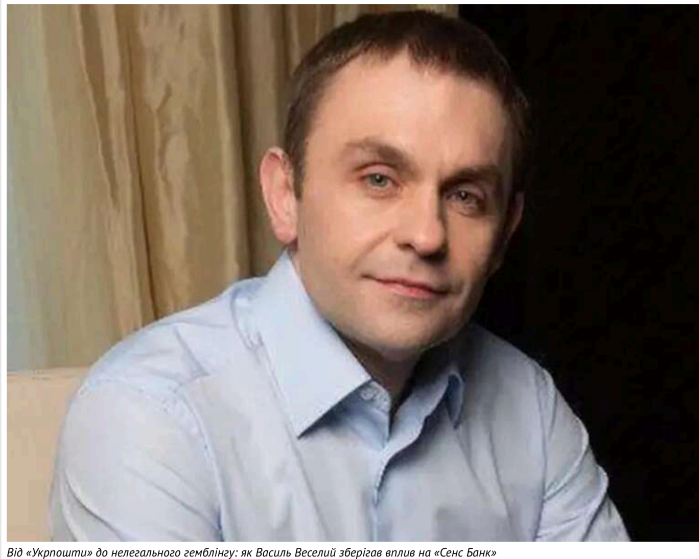
Від «Укрпошти» до нелегального гемблінгу: як Василь Веселий зберігав вплив на «Сенс Банк»

Обшуки, нелегальний гемблінг і «Сенс Банк»: хто такий Василь Веселий.