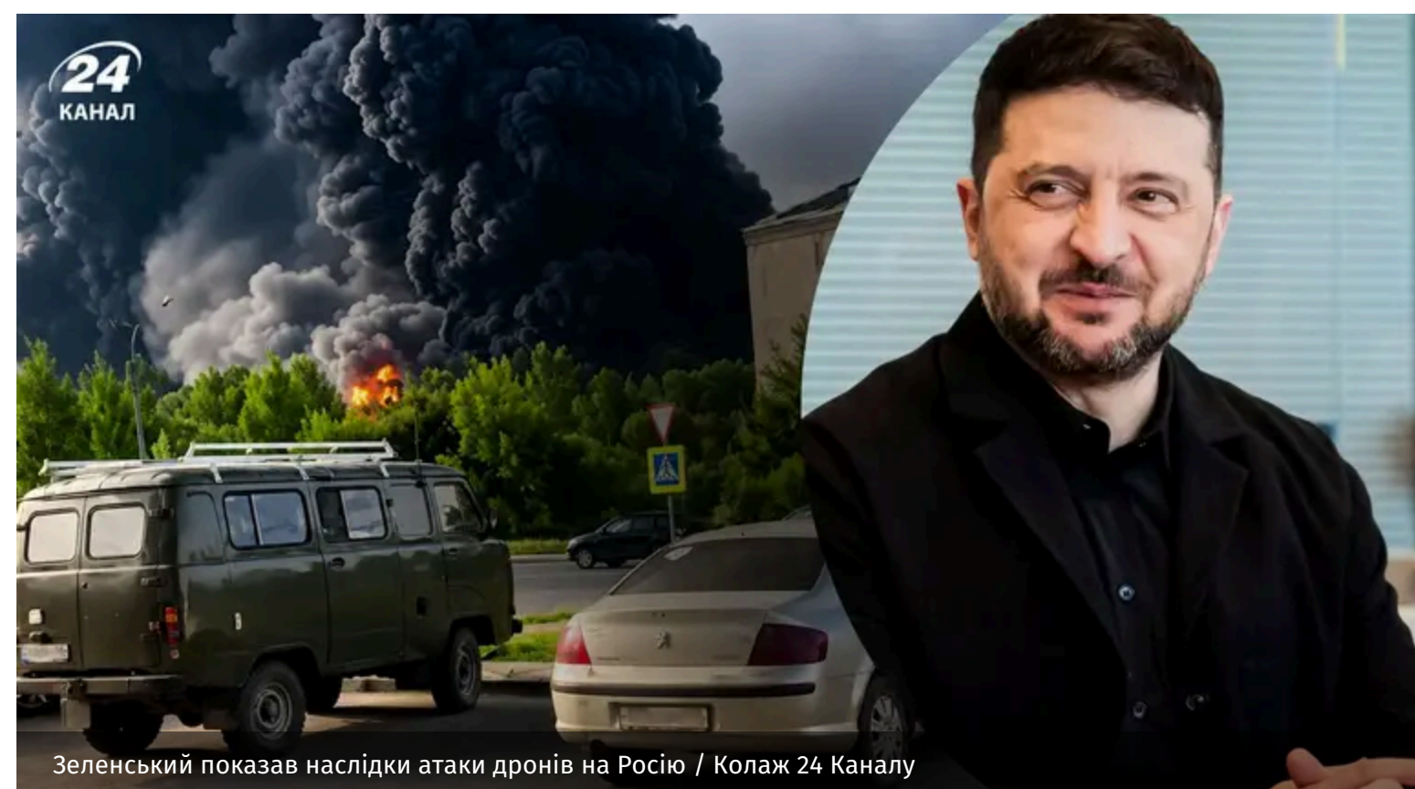
Зеленський показав наслідки атаки дронів на Росію

Українські далекобійні санкції продовжують ефективно працювати проти країни-терористки. Зокрема, 14 червня під ударом опинилися ворожі об'єкти одразу в кількох регіонах Росії. Ураження зафіксовані на відстані в понад 700 кілометрів від кордону.