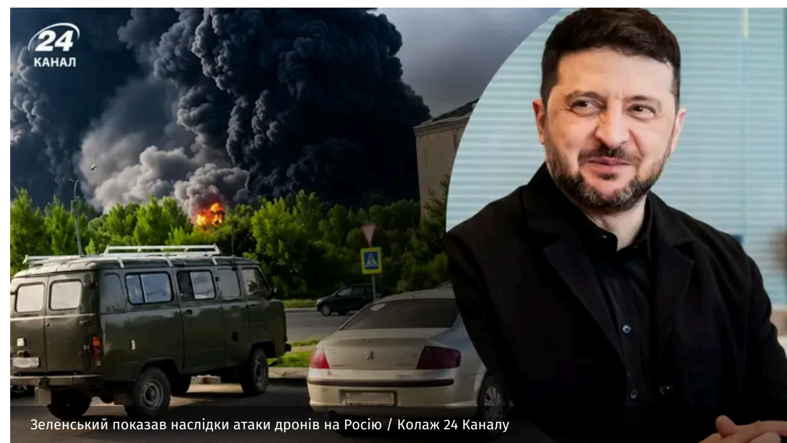
Зеленський показав наслідки атаки дронів на Росію / Колаж 24 Каналу

Українські далекобійні санкції продовжують ефективно працювати проти країни-терористки. Зокрема, 14 червня під ударом опинилися ворожі об'єкти одразу в кількох регіонах Росії. Ураження зафіксовані на відстані понад 700 кілометрів від кордону.