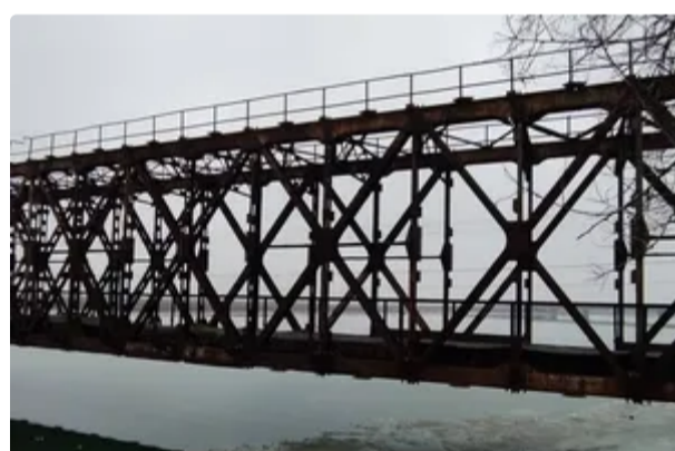
Окупанти заявили про нові атаки по мостах до Криму. В ЗСУ розповіли про наслідки 13 червня, 12:35 ВІЙНА В УКРАЇНІ