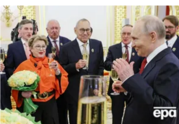
"Купка маразматиків і стара повія". Як Нейолова "зіпсувала некролог", прийнявши орден від Путіна 14 червня, 00:34 БУЛЬВАР