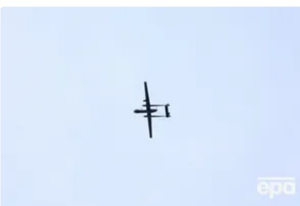
"Схоже, ціліх мостів уже не залишилося". Крим під атакою, ЗСУ "відрізають" півострів 11 червня, 10:18 ВІЙНА В УКРАЇНІ