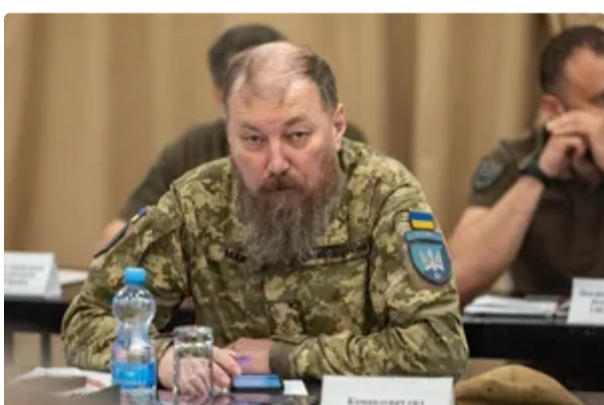
"Як стріляти по куріпках". Мадяр розповів, коли СБС візьмуть під контроль головну трасу до Криму 11 червня, 19:35 ВІЙНА В УКРАЇНІ