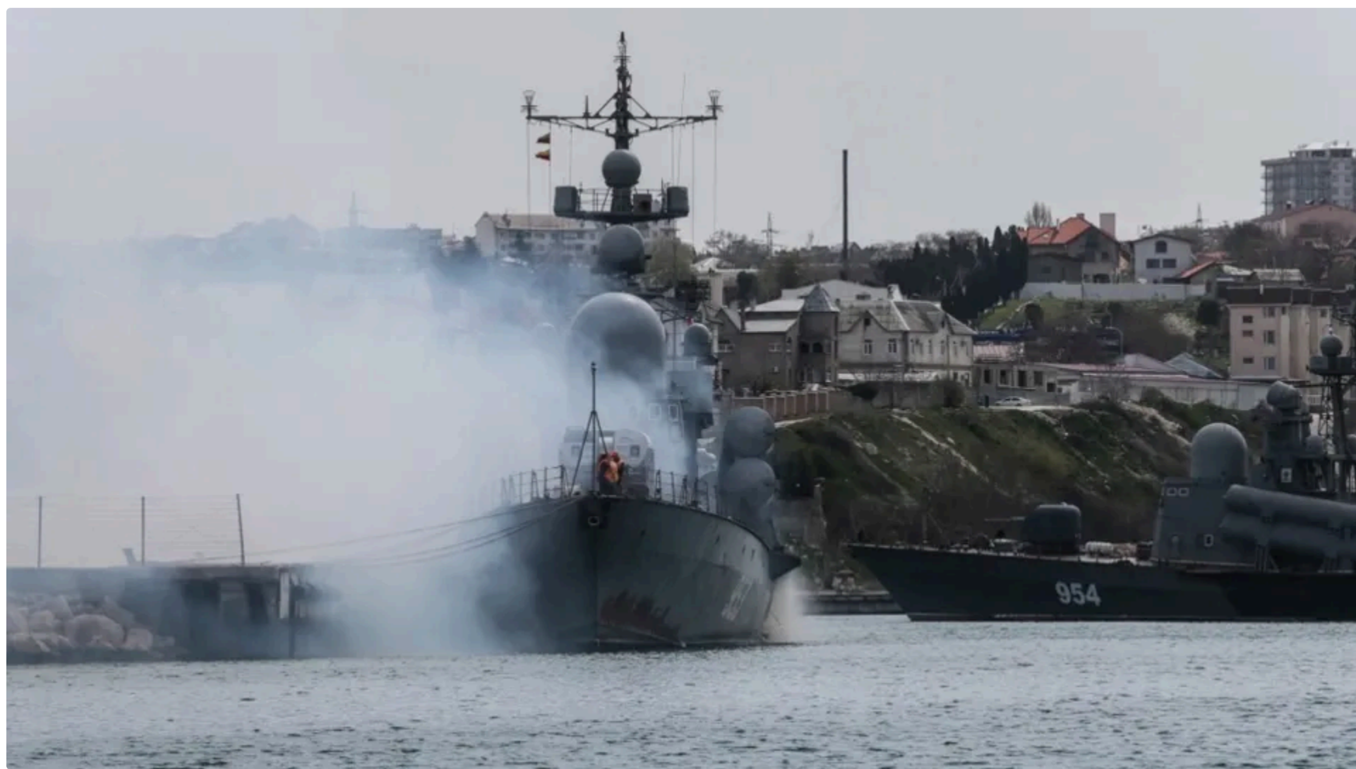
Командування ЧФ РФ планує перемістити штаб з окупованого Севастополя до Новоросійська

Партизанський рух "Атеш" 14 червня у Telegram заявив про плани командування Чорноморського флоту країни-агресора Росії щодо перенесення органів управління у Новоросійськ.