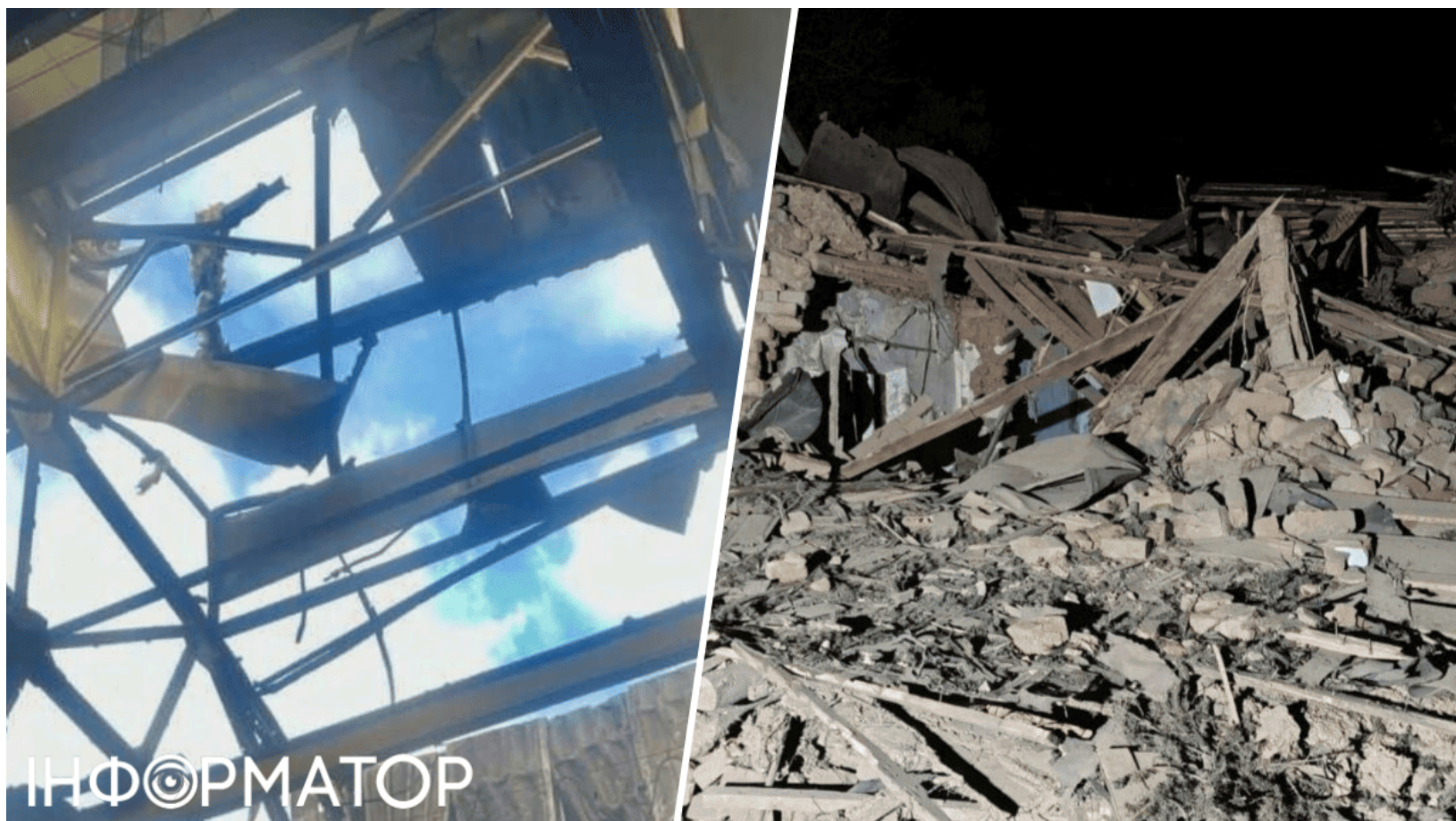
Ворог пошкодив підприємство

Російські війська 14 червня завдали удару по Дніпру - семеро мирних мешканців міста отримали поранення. Атаки на Дніпро дронами з пораненими фіксують уже не вперше - місто регулярно перебуває під ворожими ударами. Цього разу під обстріл потрапило підприємство легкої промисловості, де зруйнована стеля та понівечене виробниче обладнання.