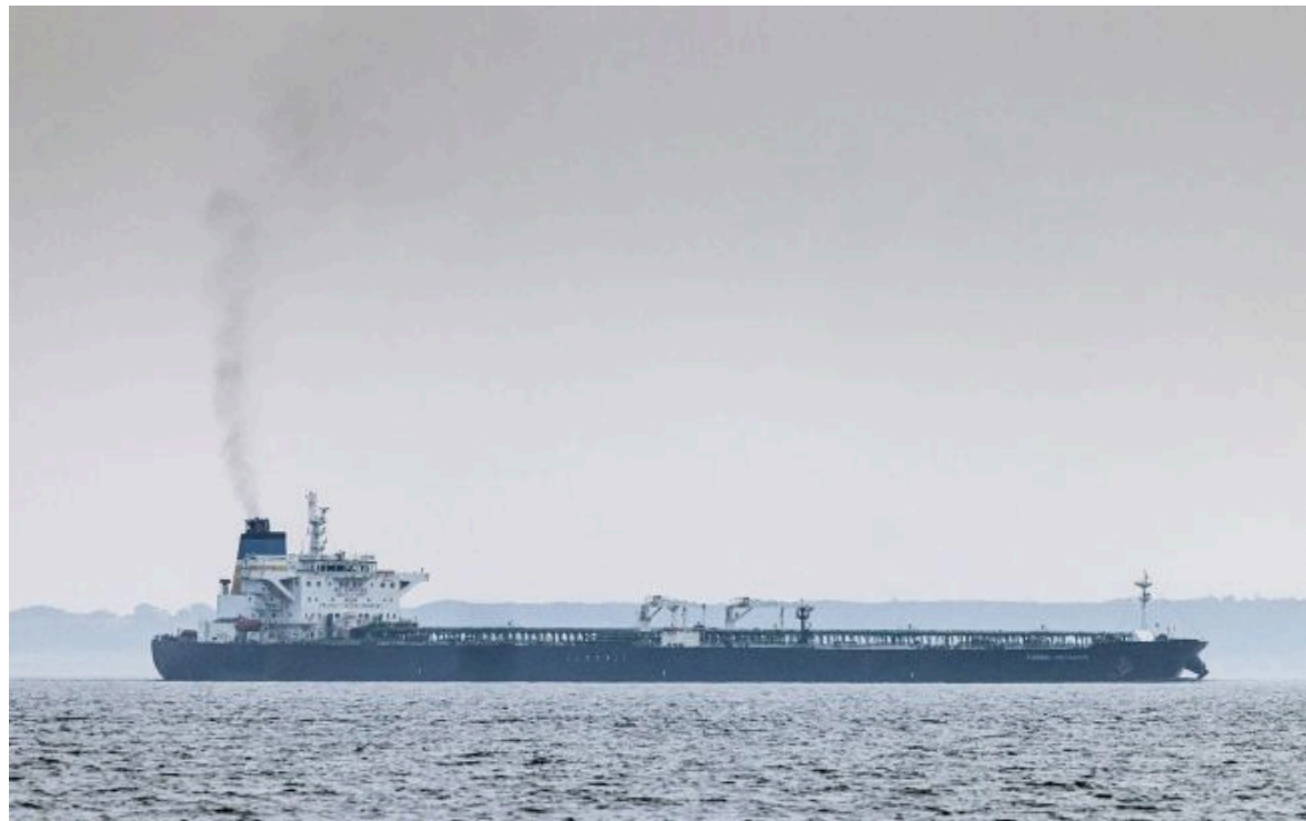
Фото: Британські військові перехопили танкер РФ - Стармер прокоментував операцію

Вимкни хаос міжнародних новин! Отримуй тільки важливе з РБК-Україна у Google