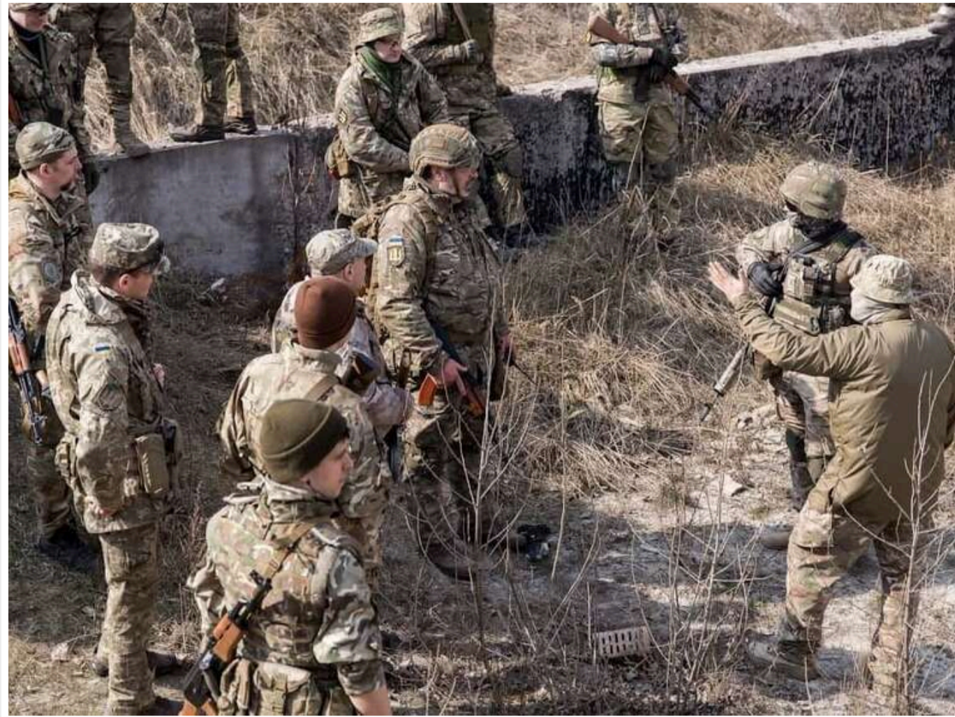
«Просто продовжена відпустка»: після закінчення контракту зі ЗСУ отримати бронь не вдасться, — Гончаренко

Народний депутат Олексій Гончаренко стверджує, що військовослужбовці, які уклали контракт із ЗСУ, після його закінчення не зможуть оформити бронь від мобілізації.