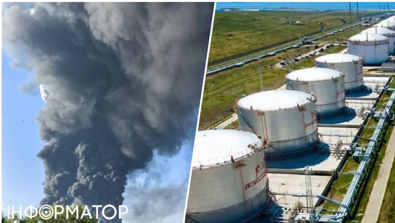
Удари по нафтовій інфраструктурі Росії

Упродовж 14 червня українські Сили оборони завдали серії ударів по стратегічній енергетичній та хімічній інфраструктурі Росії відразу в трьох регіонах країни-агресора. Підрозділи DeerStrike спільно з воїнами ЦСО "Альфа" СБУ та ГУР МОУ атакували найбільший на півдні нафтогазовий термінал, хімічний комбінат і велику паливну базу в Ярославській області. Кожен об'єкт забезпечує або потреби російської армії, або доходи від експорту вуглеводнів.