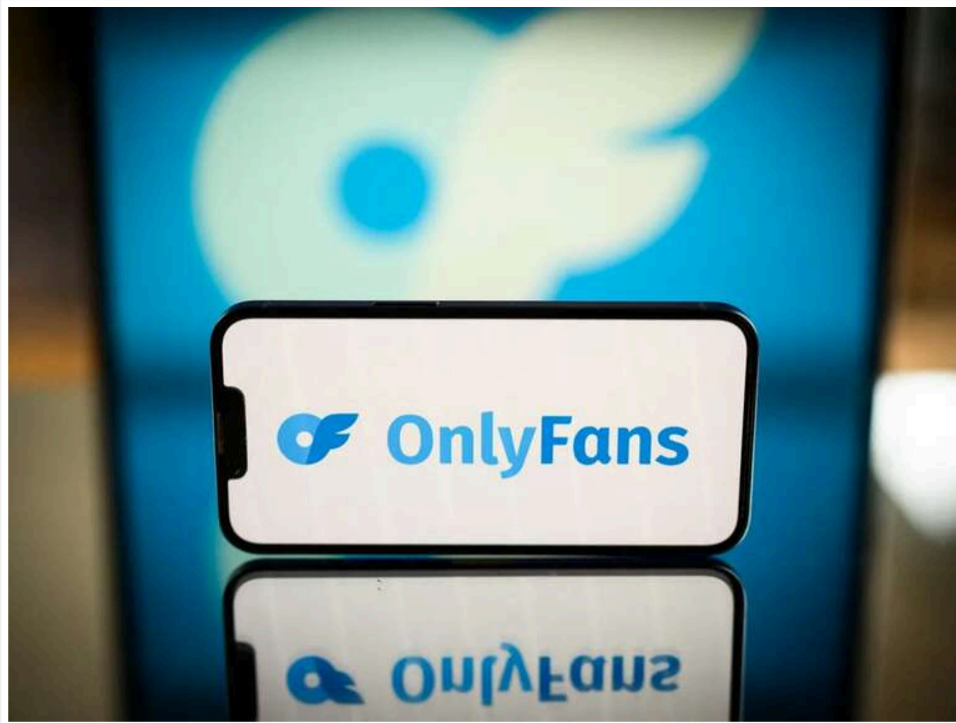
Спроба приховати доходи провалилася: Модель OnlyFans з Кропивницького змусять сплатити податки за даними з Британії

Читати на руском Read in English Додати як бажане джерело в Google