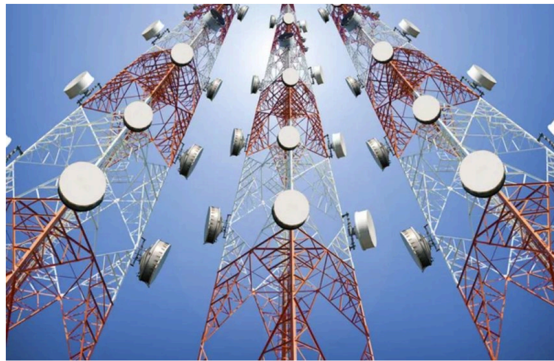
Україна застосувала санкції проти російських мобільних операторів та інтернет-провайдерів

Президент Володимир Зеленський підписав указ, яким увів у дію рішення Ради національної безпеки і оборони України щодо застосування санкцій проти 10 російських мобільних операторів та інтернет-провайдерів.