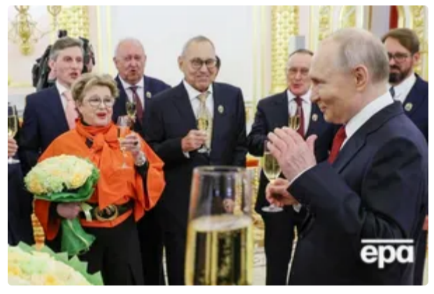
"Купка маразматиків і стара повія". Як Нейолова "зіпсувала некроло", прийнявши орден від Путіна 14 червня, 00.34 БУЛЬВАР