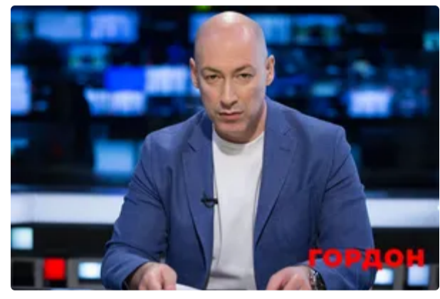
Гордон публічно висміяв російську блогерку, яка стала найвпливовішою людиною в РФ 13 червня, 23.01 БУЛЬВАР