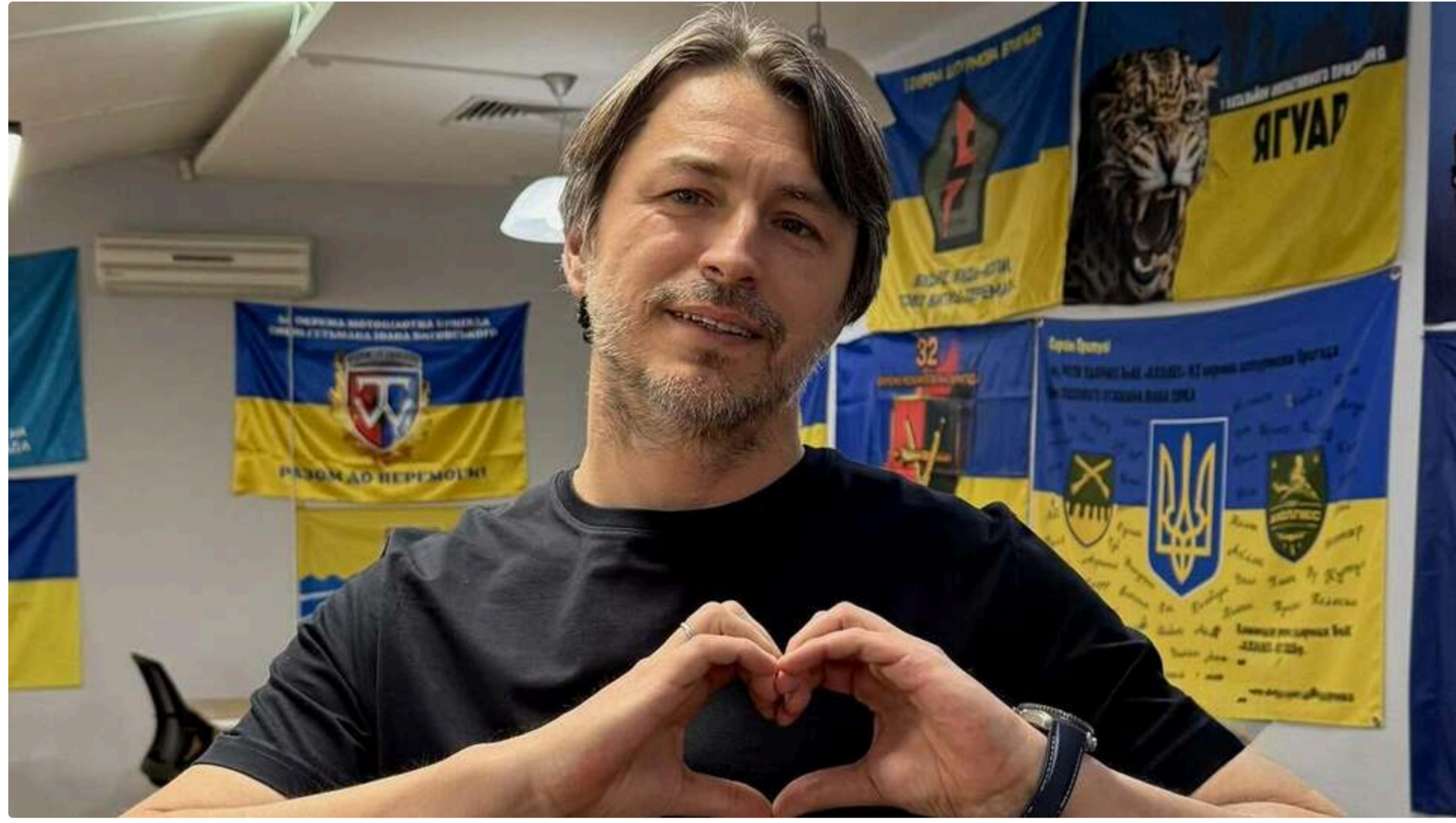
Притула: Є особа в Кремлі, і відштовхуючись від його риторики, швидкого завершення очікувати не варто

14 червня, 08.35 🗣️ Етот материал также можно прочитать на русском