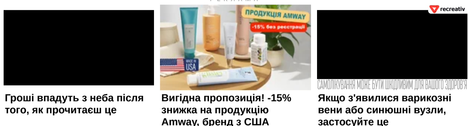
Гроші впадуть з неба після того, як прочитаєш це

Як читати "ГОРДОН" на тимчасово окупованих територіях Читати