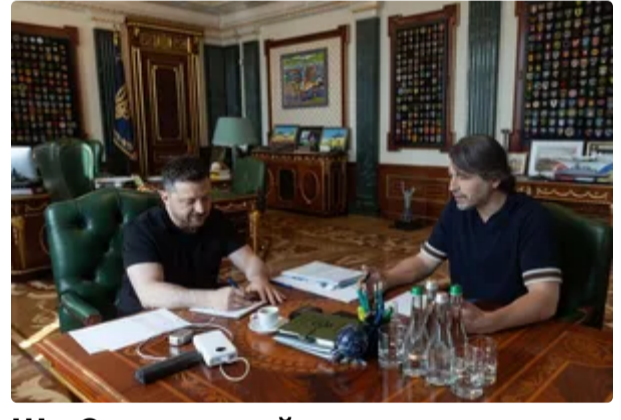
Що Зеленський думає про Міндінча. Притула розповів подробиці зустрічі з президентом 13 червня, 01.05 СУСПІЛЬСТВО