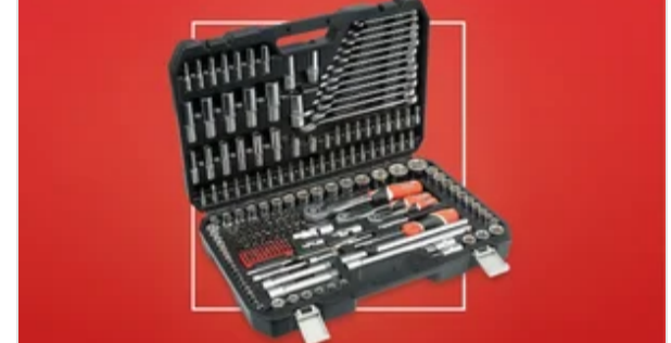
Все під рукою – кейси з інструментами за вигідними цінами!