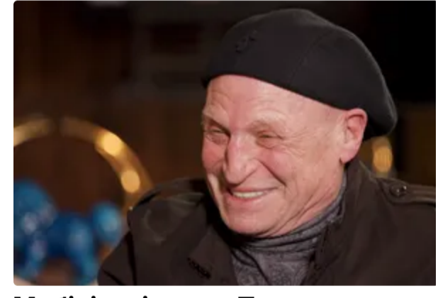
Мобілізація сина Притули, смерть Норріса і зоряний час Буряковського. Що сталося в березні 1 квітня, 23.27 НОВИНИ