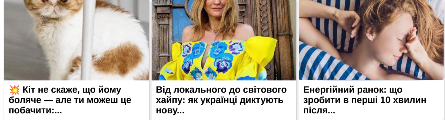
🐾 Кіт не скаже, що йому боляче — але ти можеш це побачити...