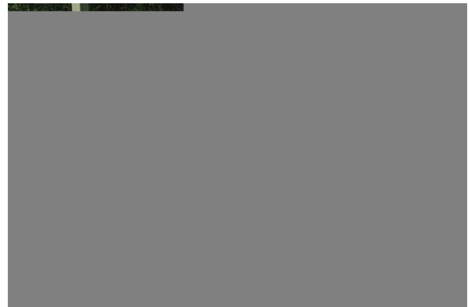
Так бавляться білі леви, коли не сплять.

Не поталанило нам побачити і блакитні очі білого бенгальського тигра - штучно виведеної спеціально для зоопарків популяції. Зате його спиною, вигадливо розмальованою чорними смужками, ми намиливалися.