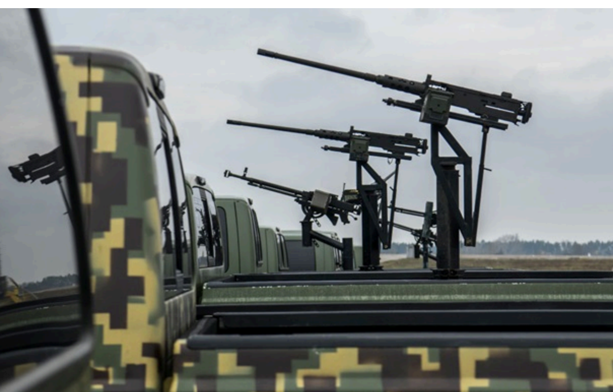
ППО знищила 91 ворожий дрон

Зафіксовано влучання семи ударних дронів на шести локаціях, а також падіння уламків на чотирьох. У ніч на неділю російські війська запустили по Україні 98 безпілотників різних типів. Підрозділи ППО перехопили більшість ворожих цілей. Про це повідомили Повітряні сили ЗСУ 14 червня.