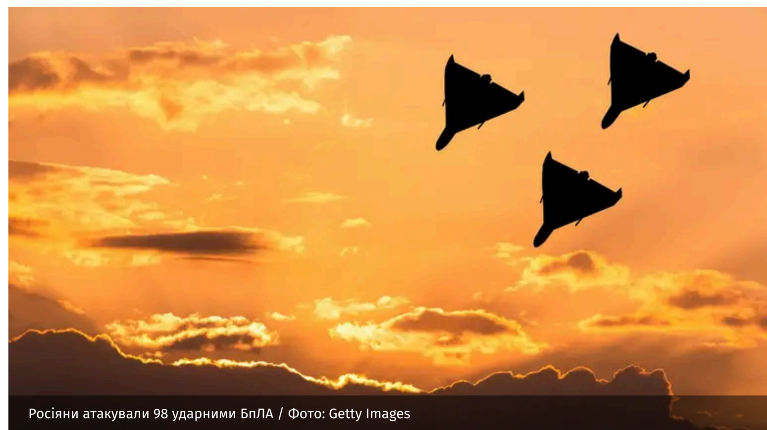
Росіяни атакували 98 ударними БПЛА

У ніч на неділю, 14 червня, російські війська вкотре атакували Україну ударними безпілотниками різних типів. Загалом силами протиповітряної оборони вдалося знешкодити 91 ворожий БПЛА.