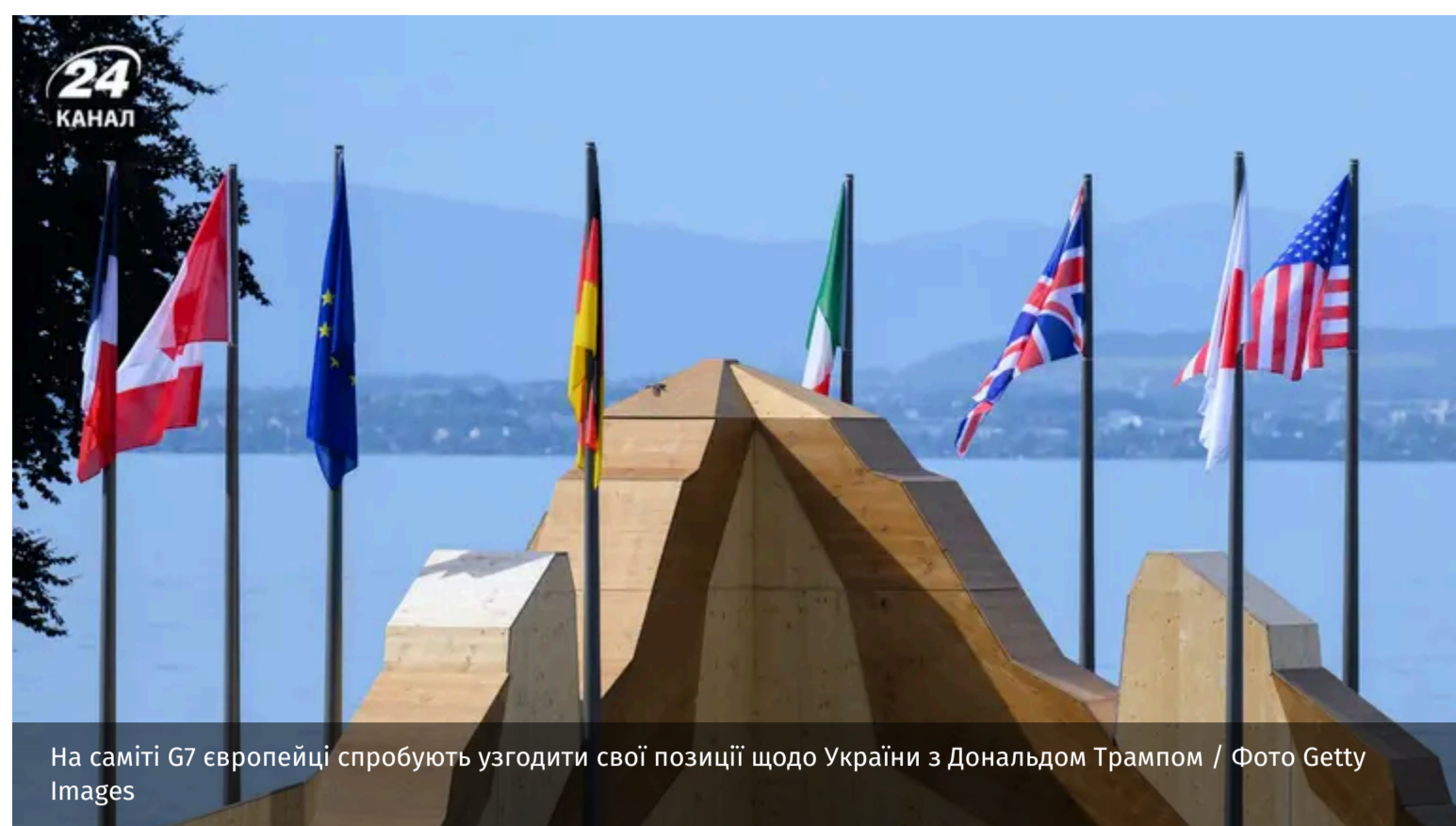
На саміті G7 європейці спробують узгодити свої позиції щодо України з Дональдом Трампом

15 – 17 червня у французькому Евіані пройде саміт лідерів G7. На ньому обговорюватимуть можливі переговори між Росією та Україною.