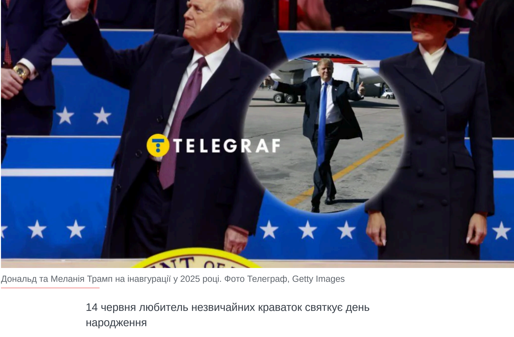
Дональд та Меланія Трамп на інавгурації у 2025 році.

14 червня любитель незвичайних краваток святкує день народження