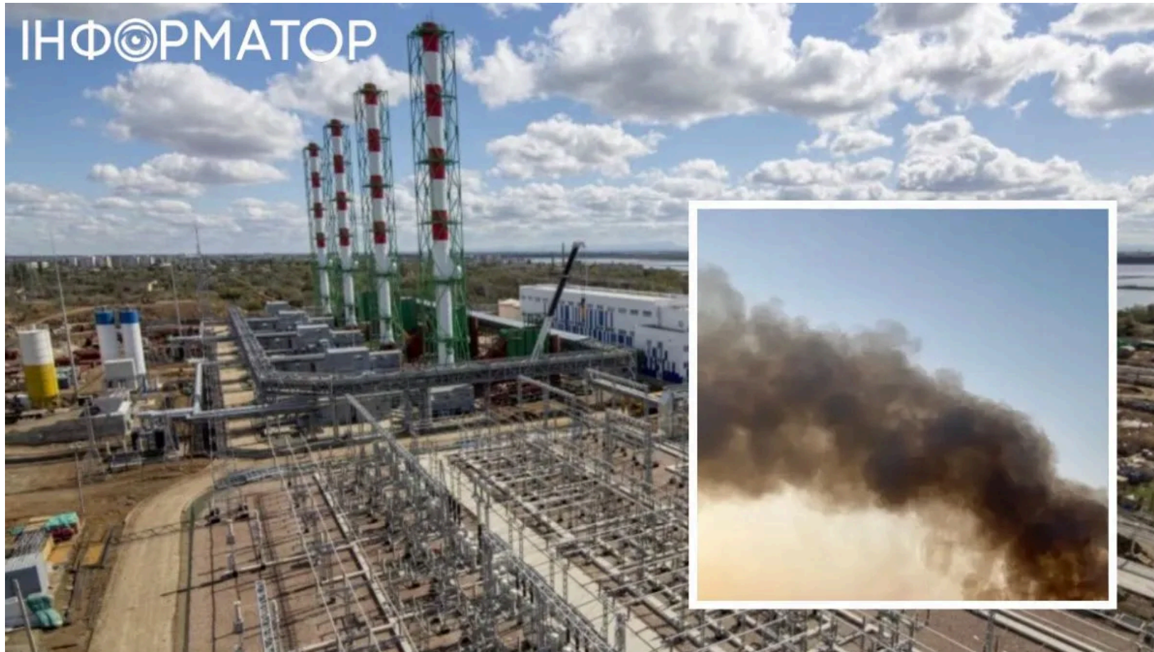
Удар по Сакській ТЕЦ - вибухи та блекаут у Криму

В окупованому Криму пролунала серія потужних вибухів - місцеві жителі повідомляють про удар по Сакській теплоелектроцентралі та масштабні перебої з електропостачанням. Після прильоту зникло світло у місті Саки та прилеглих селах, а у селищі Гвардійське знеструмлення тривало щонайменше 30 хвилин. Водночас у Сімферополі мешканці чули потужний вибух у районі ГРЕС, після якого пролунав звук, характерний для роботи російської ППО.