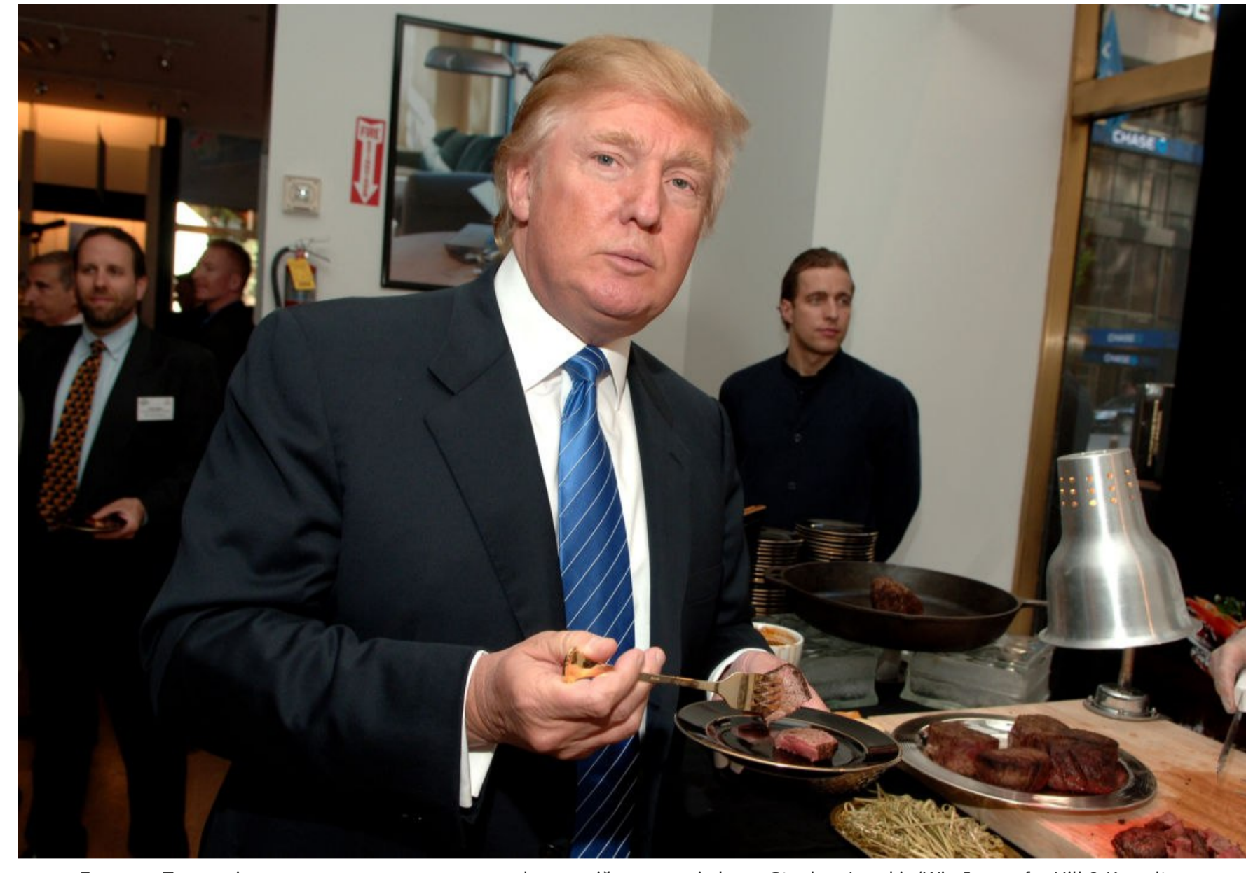
Дональд Трамп віддає перевагу прожареному м'ясу, сухій витримці. Фото: Stephen Lovekin/WireImage for Hill &amp; Knowlton

Шеф-кухарі елітних ресторанів по всьому світу буквально ридали. Засмажити дороге м'ясо до стану «підшоши» і залити його цукром із кетчупу вважається у вищому товаристві абсолютним гріхом.