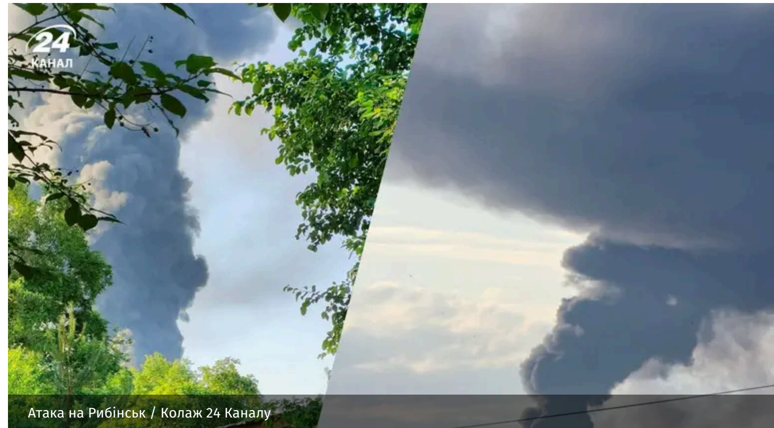
Атака на Рибінськ

Жителі Ярославської області Росії 14 червня відчували на собі чергову дронову атаку. Безпілотники вдарили по нафтобазі в Рибінську.