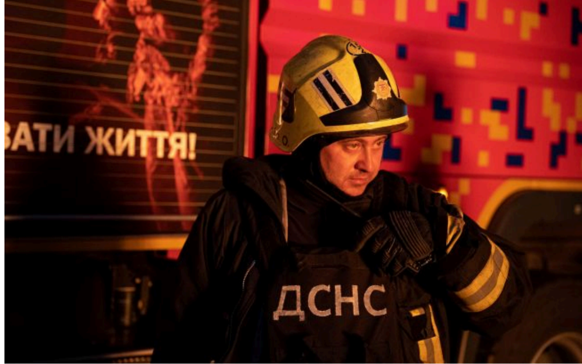
Фото: обійшлося без постраждалих