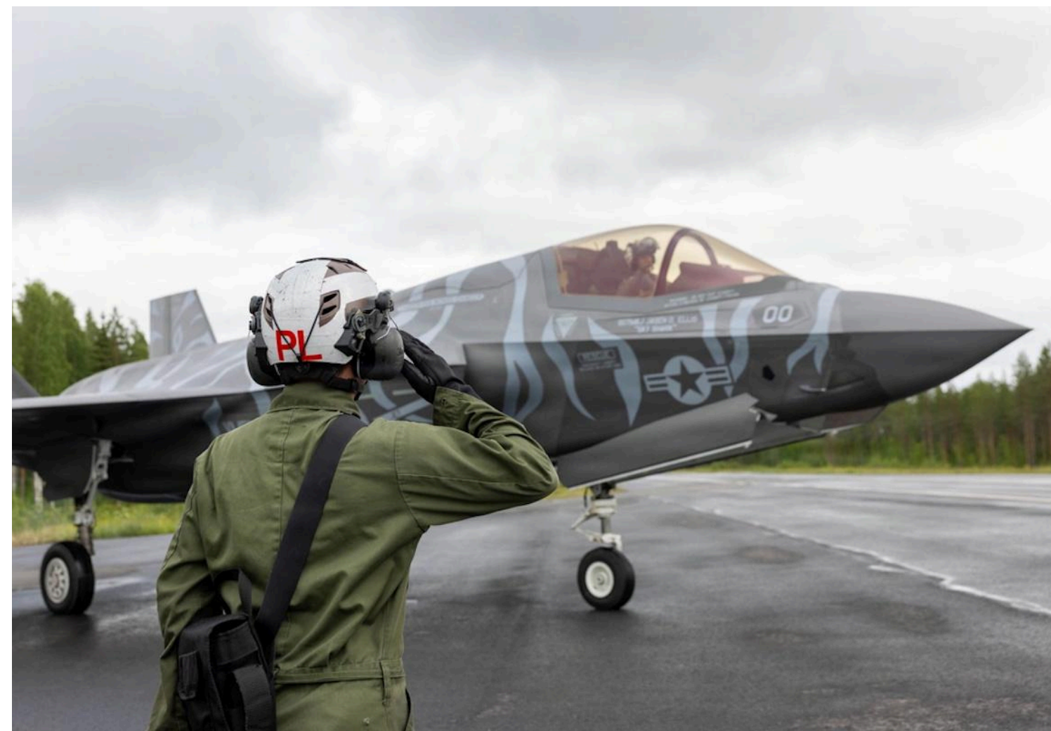
Американський F-35 на навчаннях у Фінляндії

У разі війни з Китаєм воювати американцям буде нічим.