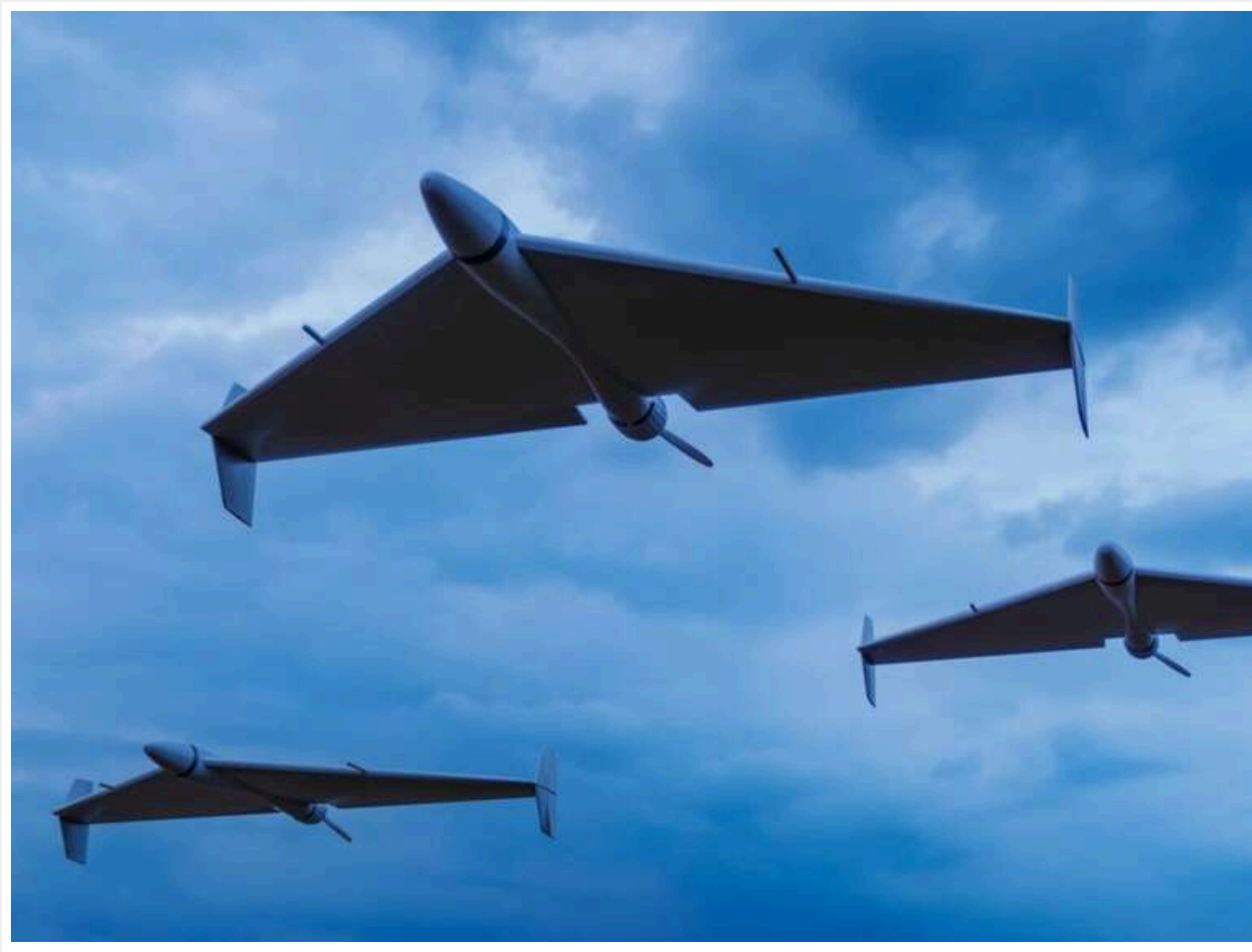
Окупанти атакують Україну 'шахедами'

Читати на руськом Додати як сайтане джерело в Google