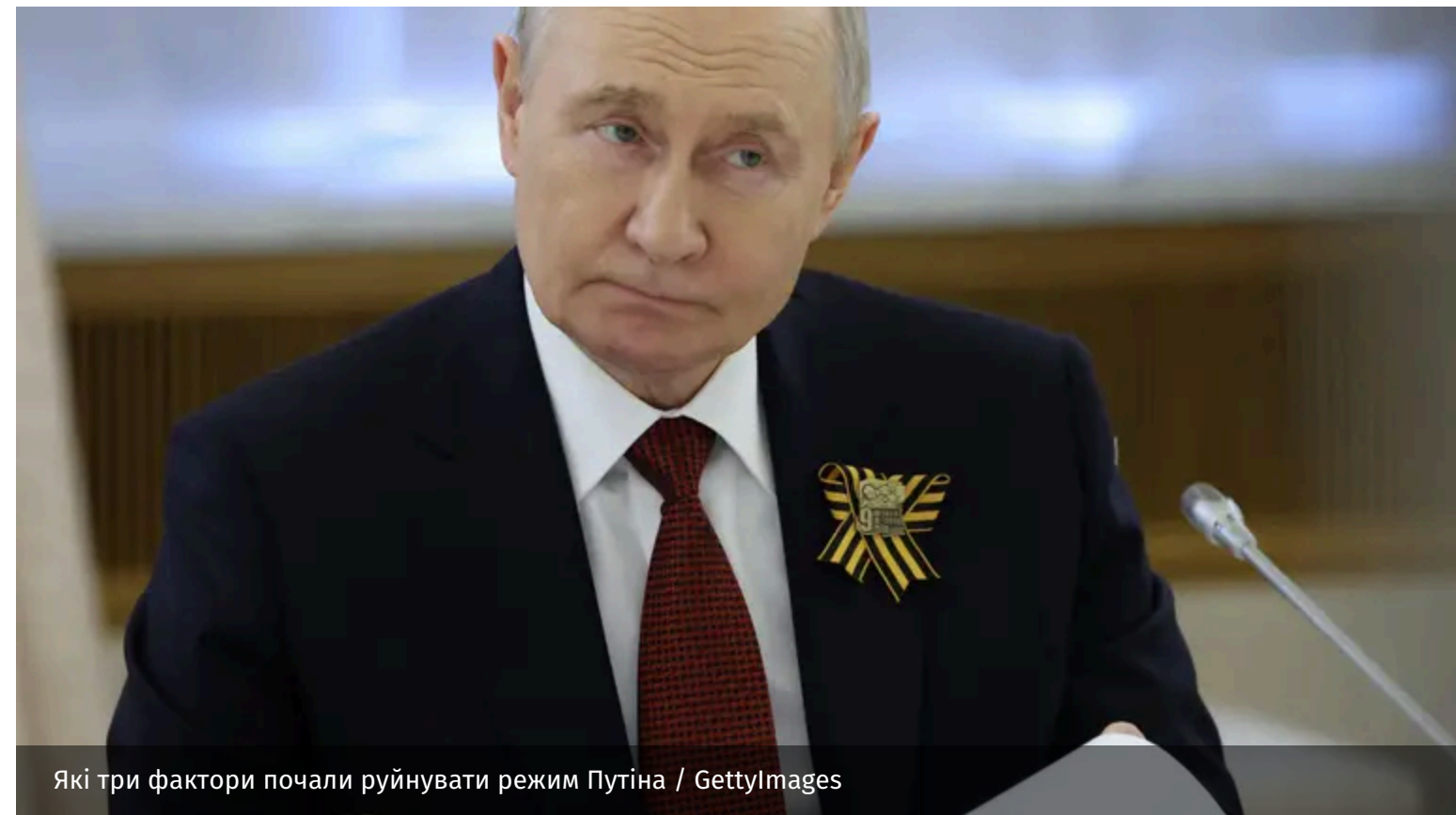
Які три фактори почали руйнувати режим Путіна

Серія символічних поразок Путіна – дрони над Москвою, скасування параду та відсутність святкувань до дня Росії – свідчать про ослаблення режиму. До цього додається й те, що діючий ведучий кремлівського телеканалу публічно порівняв Росію з літаком, що падає.