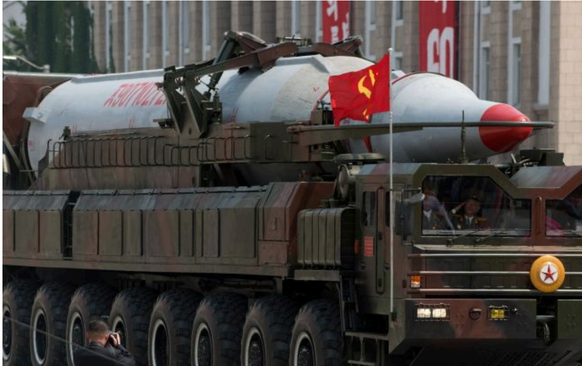
Фото: КНДР залишиться з ядерною зброєю