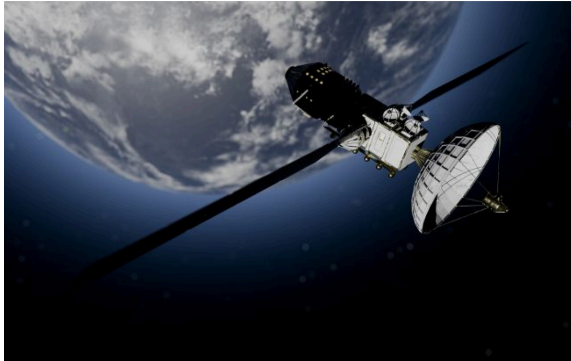
Фото: космічний супутник