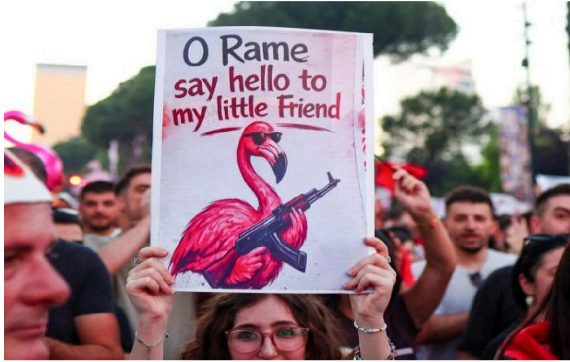
Фото: протести в Албанії