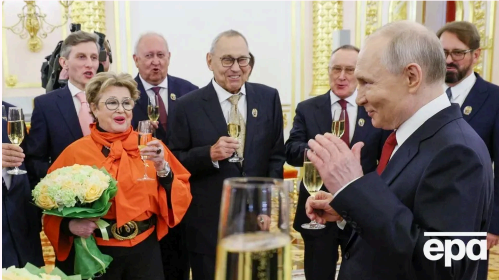
Позуючи після нагородження, актриса схопила Путіна за мізинець

14 червня, 00:34 Цей матеріал також можна прочитати на руськом