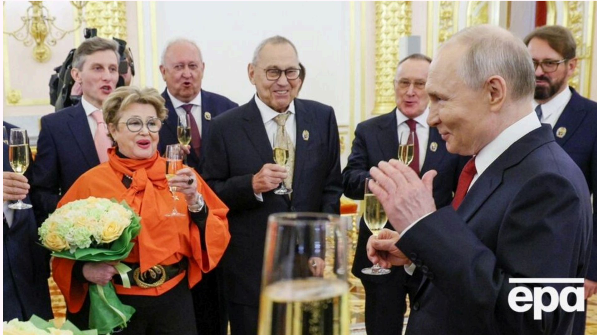
Позуючи після нагородження, актриса схопила Путіна за мізинець

14 червня, 00:34 Этот материал также можно прочитать на русском