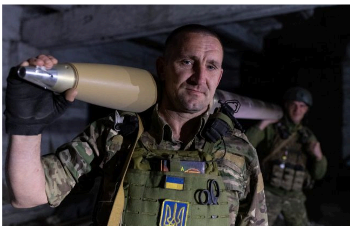
Фото: гарантована відстрочка для всіх - піароку