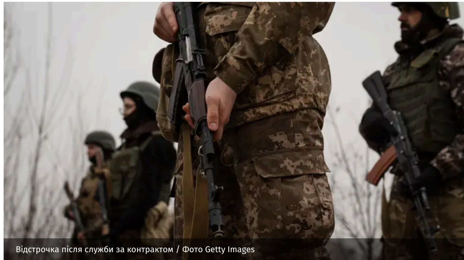
Відстрочка після служби за контрактом

Військових одразу не мобілізуватимуть після завершення контракту. Їм надаватимуть відстрочку щонайменше на пів року.