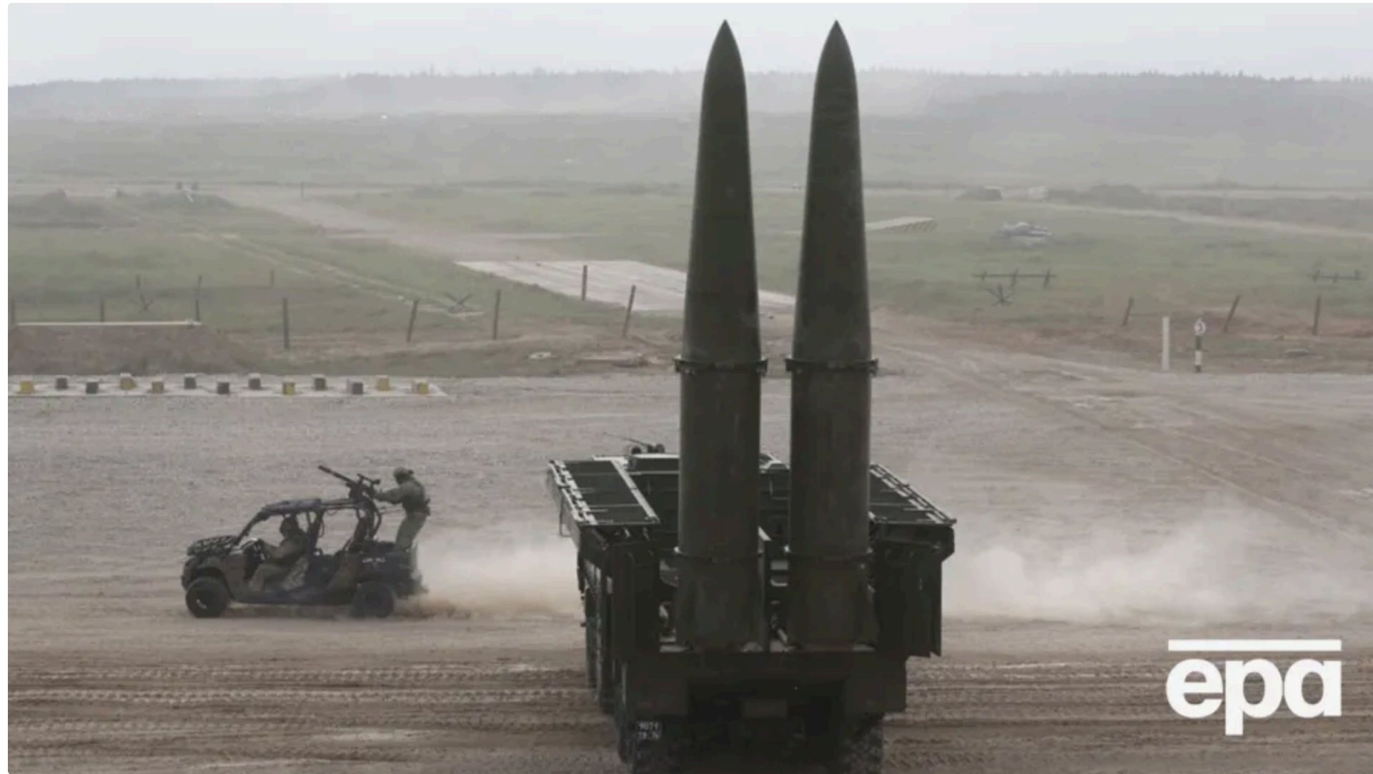
За словами Заруби, дальність ракети "Іскандер-М" може сягати 1 тис. км

14 червня, 00:00 🗨️ Цей матеріал також можна прочитати на руском