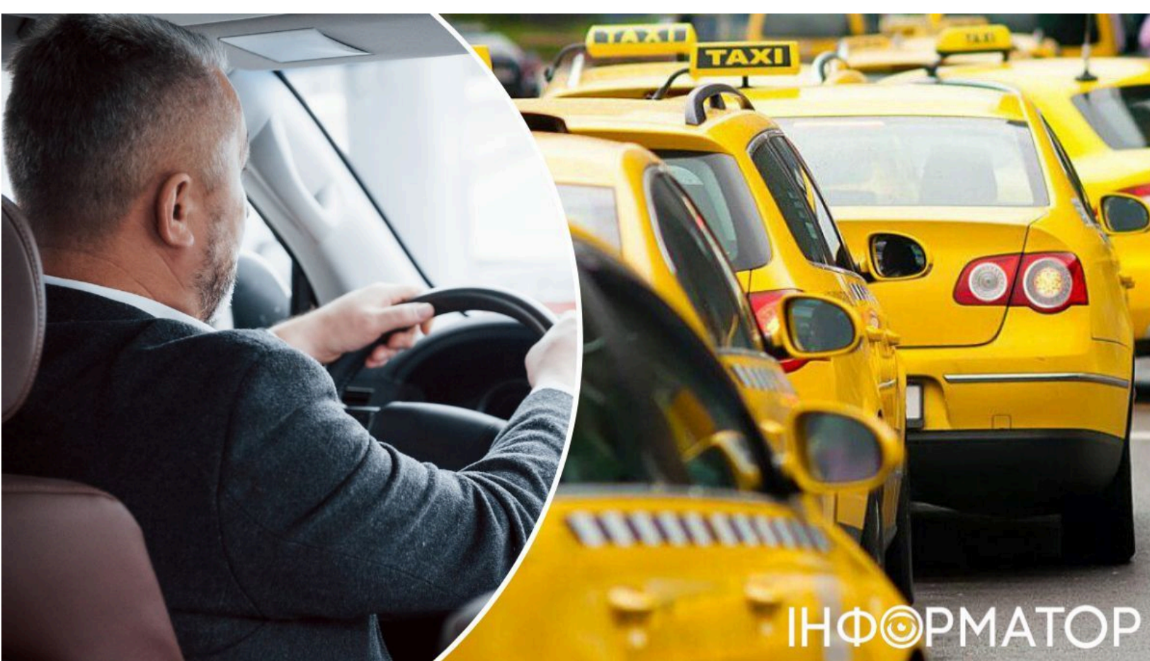
Нова перевірка для таксистів-українців у Польщі

Польща готується ввести нові вимоги для водіїв таксі, які приїхали з країн поза межами Євросоюзу - зокрема й з України. Польща вже змінювала правила руху у червні цього року - тоді нові норми торкнулися водіїв і підлітків на самокатах. Тепер влада йде далі і береться за ринок пасажирських перевезень. Головна новація - обов'язкова довідка про несудимість із країни походження водія.