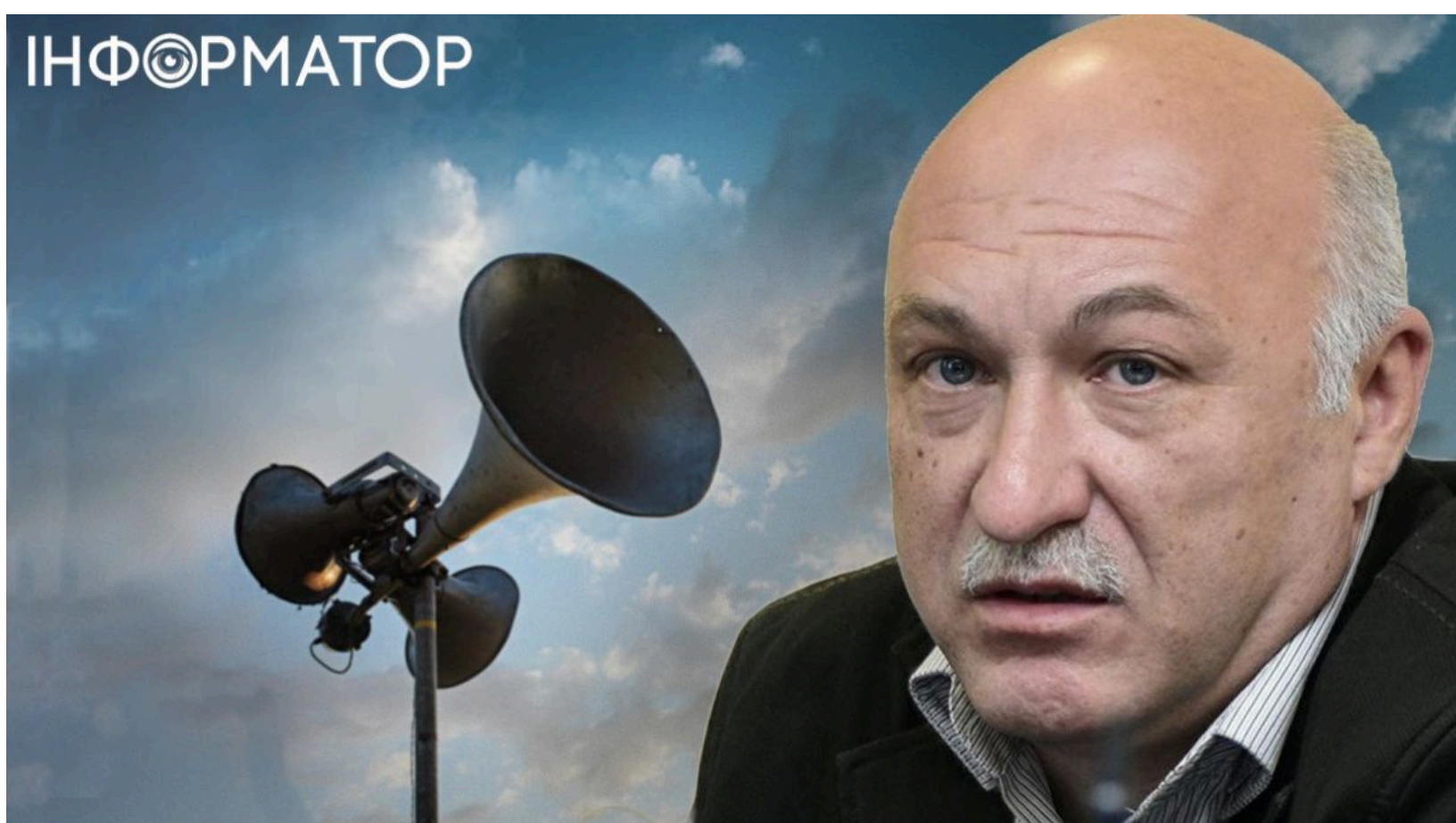
Росія змінила тактику атак по Україні

Росія з травня змінила тактику масованих ударів по Україні - тепер вона поєднує реальні обстріли з навмисним інформаційним тиском і серіями хибних тривог. Раніше дослідники розповіли про ракети Х-101 , якими РФ регулярно б'є по Україні. Паралельно ворог активно модернізує як дрони, так і ракетне озброєння, адаптуючи їх під українську систему ППО.