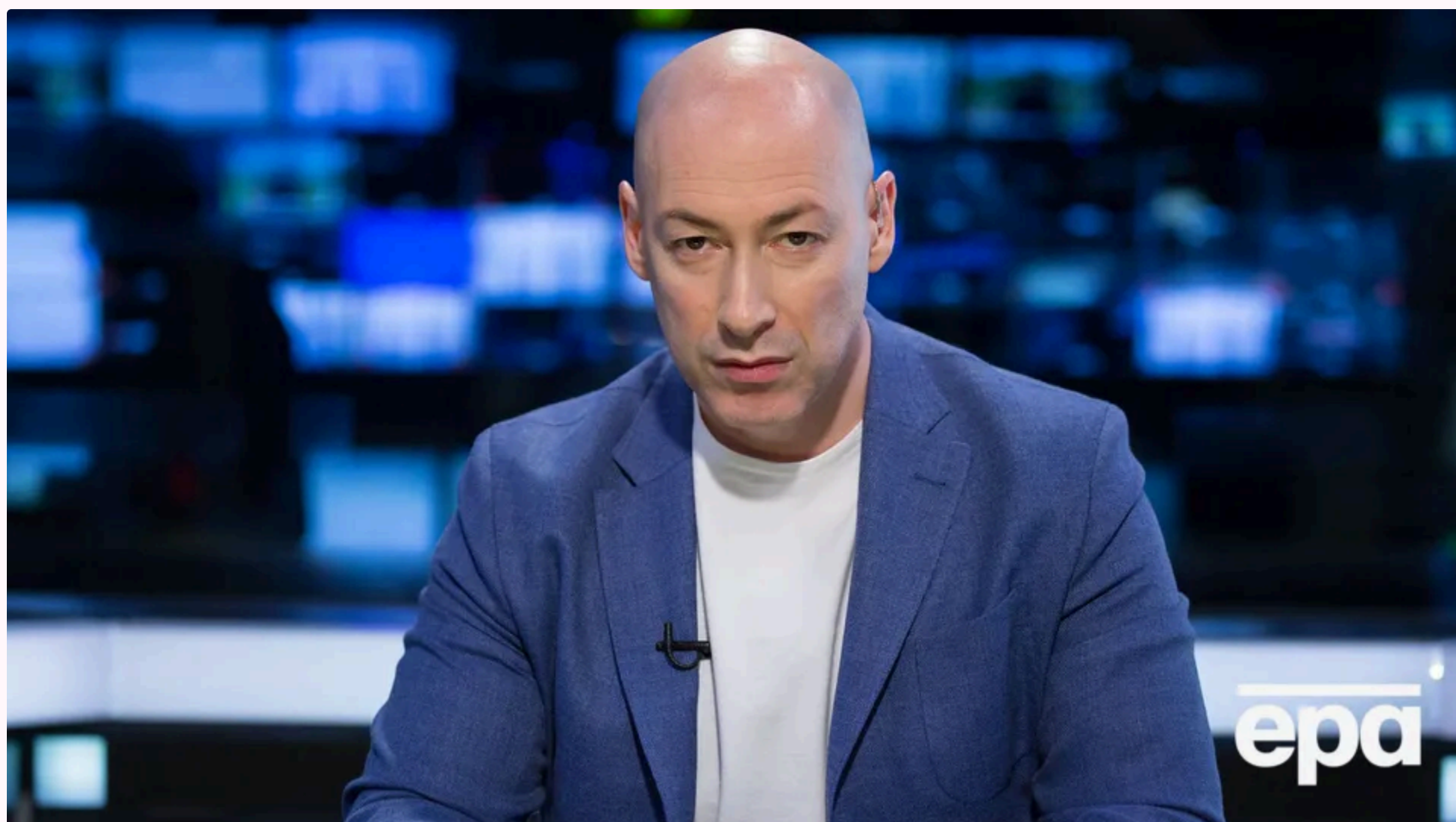
Гордон пояснив Боні, яку назву насправді має день, із якого вона вирішила привітати росіян

13 червня, 23.01 🗨️ Этот материал также можно прочитать на русском