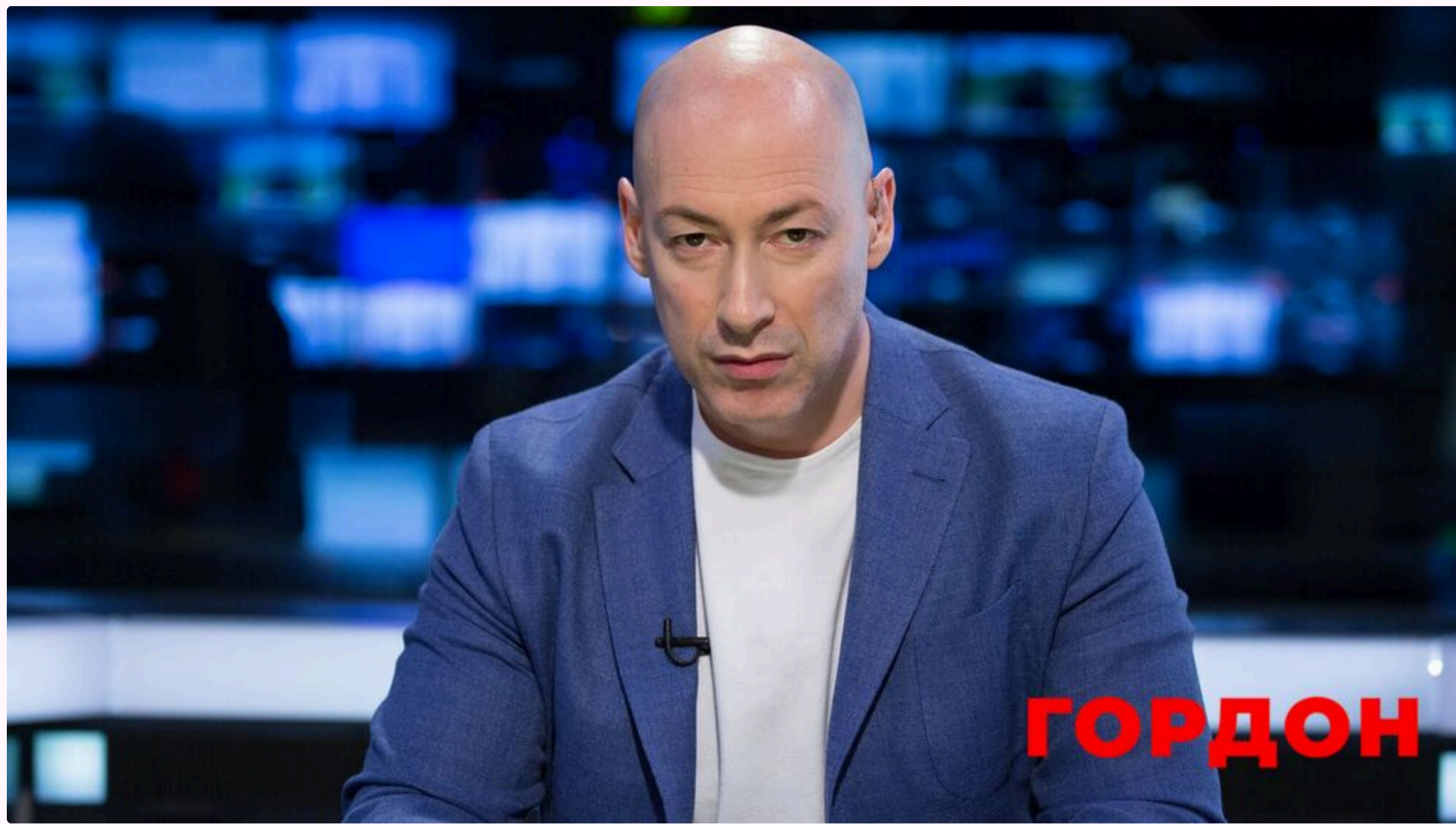
Гордон пояснює Боні, яку назву насправді має день, із яким вона вирішила привітати росіян

13 червня, 23.01 🗨️ Цей матеріал також можна прочитати на руському