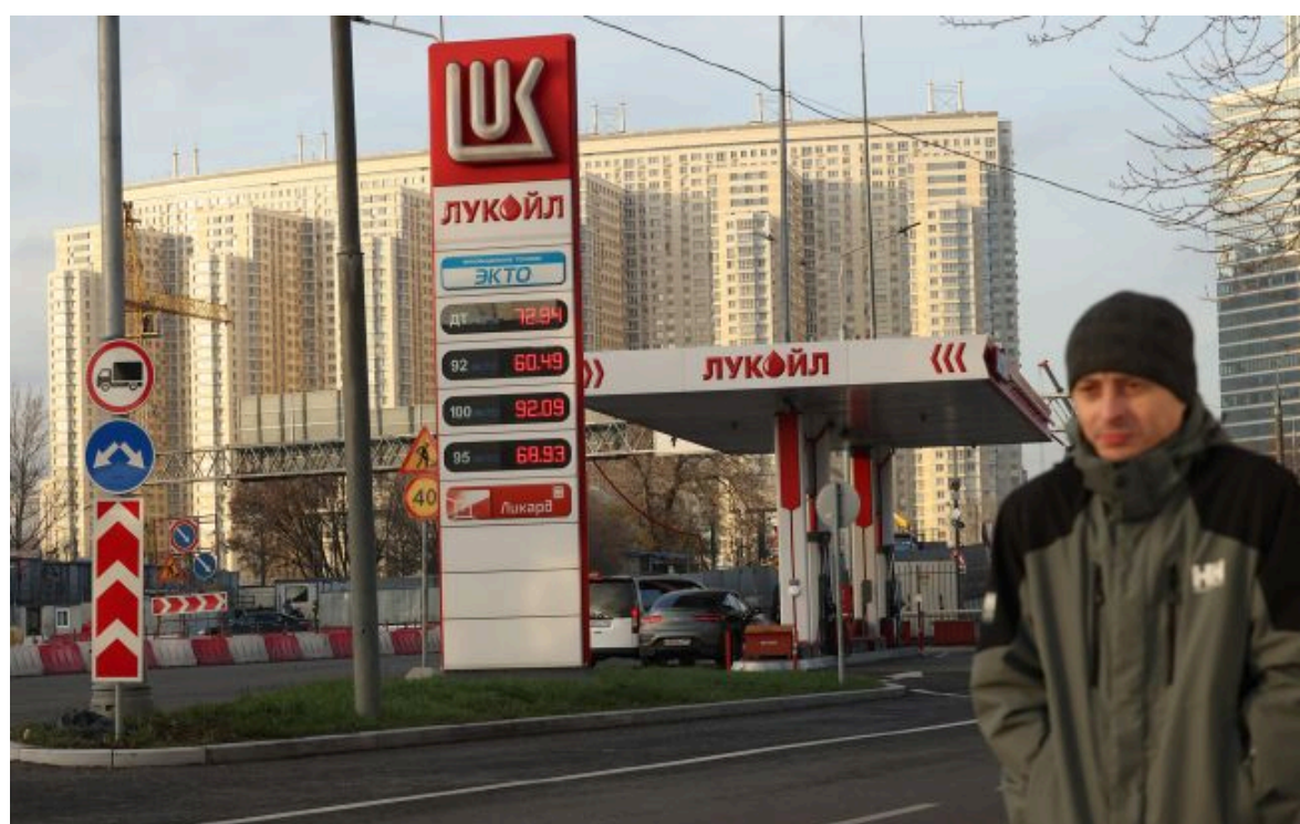
Фото: у Москві та Петербурзі ввели ліміти на заправках

Вимкни хаос міжнародних новин! Отримуй тільки важливе з РБК-Україна у Google