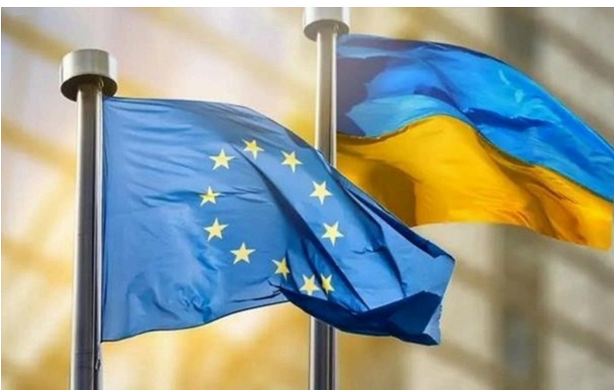
Не тільки Європа потрібна Україні, але й Україна потрібна Європі

Зеленський подякував усім тим, хто бореться за свої народи й за інтереси Європи та за безпеку у Європі, безпеку з Україною.