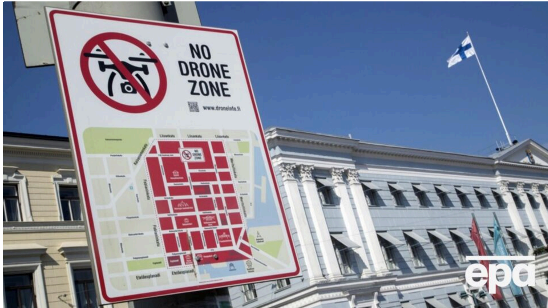
Згідно з оцінками, бойові БПЛА можуть час від часу залітати на територію Фінляндії

13 червня, 22:10 📄 Этот материал также можно прочитать на русском