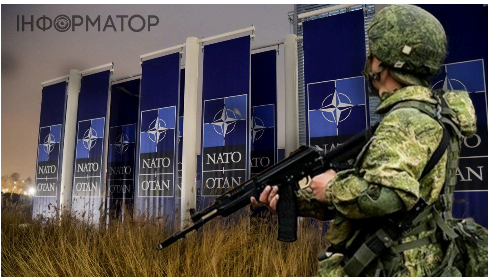
Зеленський про нові бази Росії поряд із Європою

Росія планомірно зводить нові військові бази поблизу кордонів Європи - навіть там, де їх ніколи не існувало в радянський час. Про це президент України заявив у своєму зверненні наприкінці 1571-го дня повномасштабної війни. Побювання щодо провокацій Кремля вже фіксує і НАТО. Володимир Зеленський наголосив: без України, її спроможностей і бойового досвіду Європі буде надзвичайно складно протистояти цим загрозам.