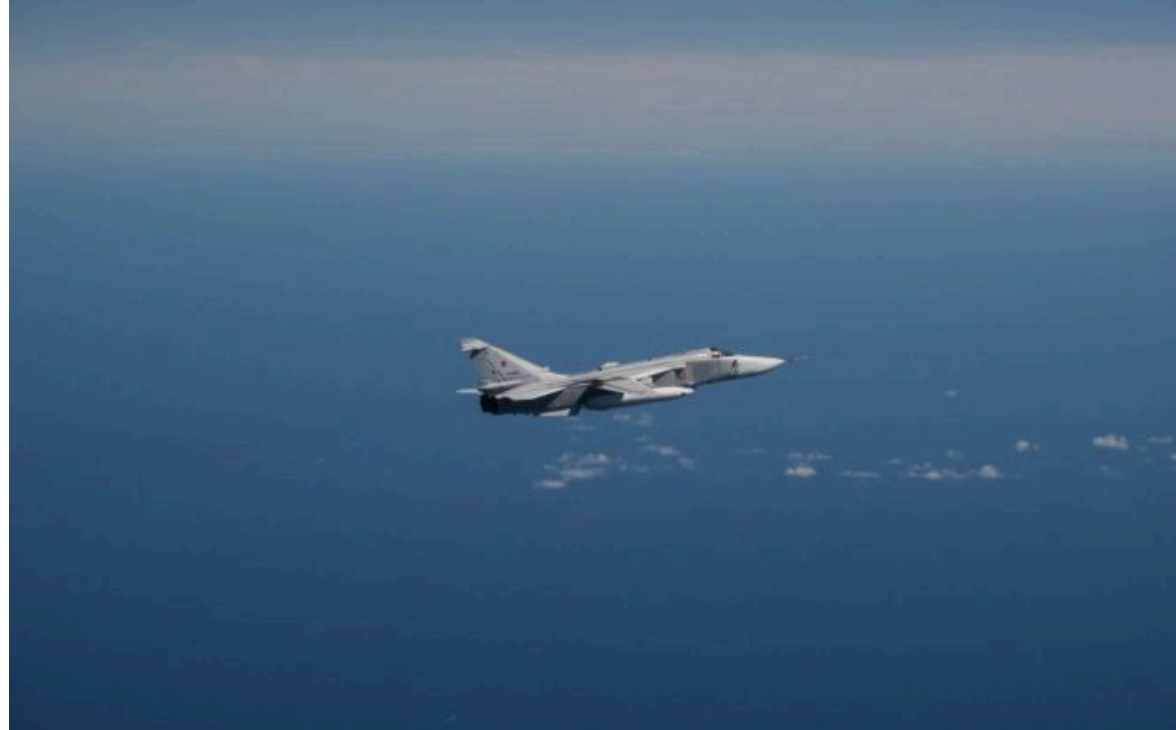
Фото: Шведські Gripen перехопили російські Су (x.com Forsvarsmakten)