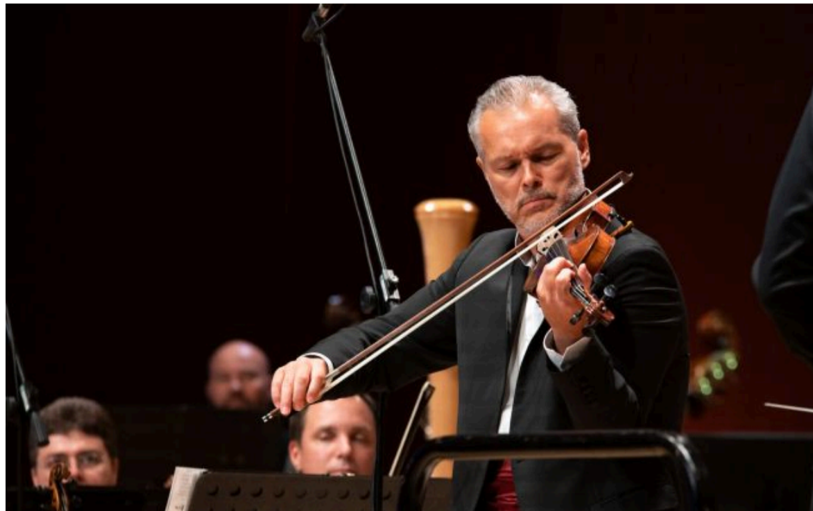
Фото: російський скрипаль Вадим Репін