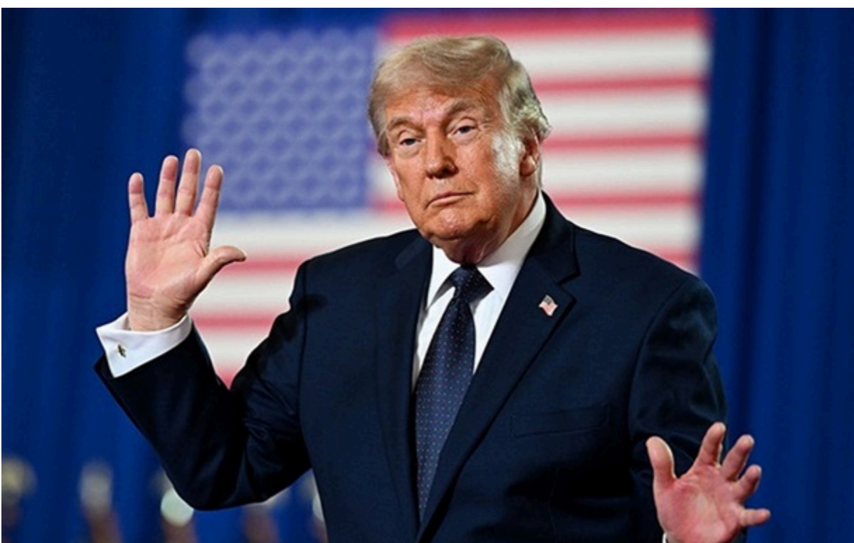
Дональд Трамп

У заяві йдеться також про те, що після підписання угоди буде відкрито Ормузьку протоку для всіх суден.