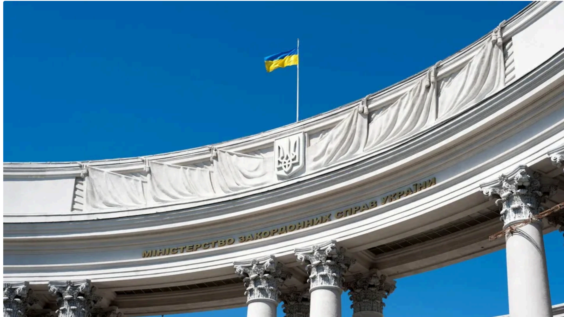
Співпраця зі США у сфері біобезпеки стосується громадського здоров'я, лабораторної діагностики й біологічного захисту, наголосили в МЗС України.

В Україні немає біологічних лабораторій, пов'язаних із розробленням, виробництвом або накопиченням біологічної зброї. Про це Міністерство закордонних справ України заявило 13 червня в Telegram.