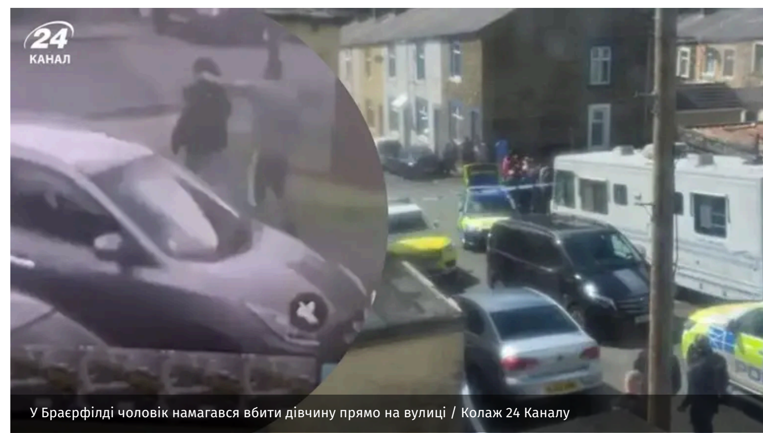
У Браєрфілді чоловік намагався вбити дівчину прямо на вулиці

У мережі з'явилося моторошне відео. На ньому просто посеред вулиці чоловік б'є дівчину ножем у шию. Поранена втікає, а нападник радісно підстрибує. Цей інцидент трапився 12 червня вдень у британському Браєрфілді.