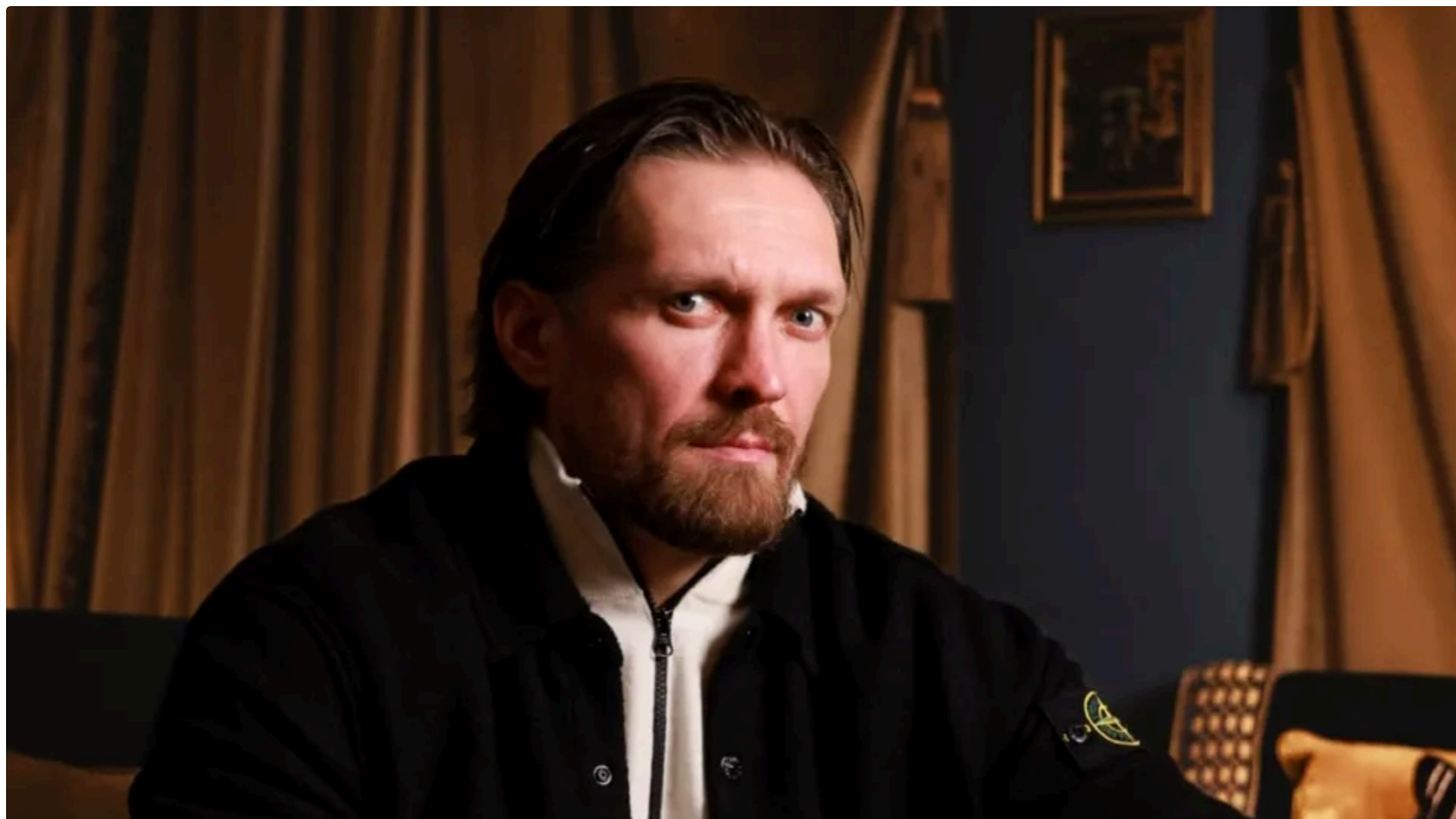
Боксер наголосив, що для українців є неприйнятною ідея відмови від територій

Україні потрібна жорсткіша й послідовніша підтримка з боку міжнародних партнерів. Про це заявив український боксер Олександр Усик під час виступу на саміті America's Adversaries: The Russia Reality, відео з якого Independent Women опублікувала в YouTube 12 червня.