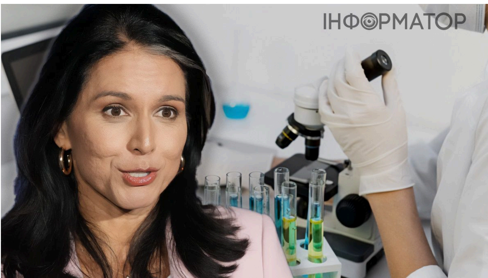
ЦПД відповів на пропаганду РФ про біолабораторії, колаж: Інформатор-Україна

Росія скористалася публікацією Нацрозвідки США про біолабораторії, щоб розгорнути нову дезінформаційну кампанію проти України. Звіт американської розвідки щодо біолабораторій 12 червня опублікувала директорка Національної розвідки США Тулсі Габбард. Москва одразу ж перетворила документ на інструмент пропаганди - всупереч тому, що в ньому реально написано.