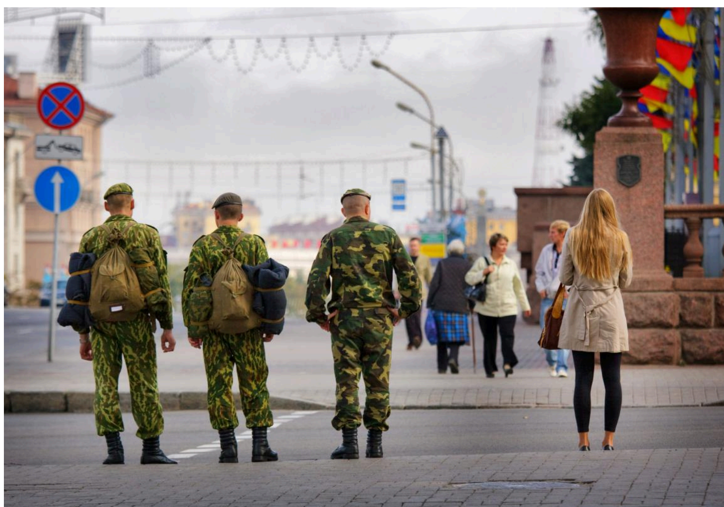
Путіну доведеться вдруге зіграти з "російською рулеткою" примусової мобілізації

Цього разу мобілізація може спричинити значно більшу паніку, ніж у 2022 році.